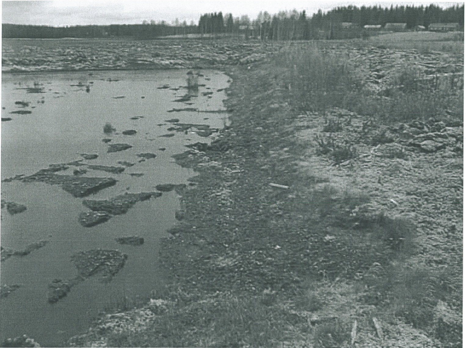
VIHANTI, RANTASENJÄRVEN KUNNOSTUSTYÖMAATA 31.10.01 P. KOIVONEN DIGI-KUVA OY/ARK.LAB.