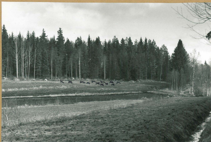
f. 64133. Asuinpaikka etelälounaasta