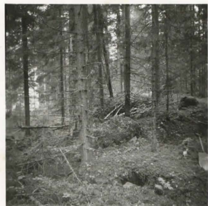
F. 17680. Kivi sijaitti louhikkoisessa maastossa.