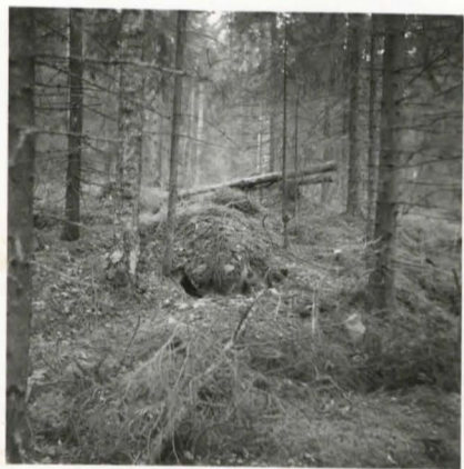
F. 17678. Saviastian 12867 löytöpaikka kuvassa näkyvän kiven kolossa.