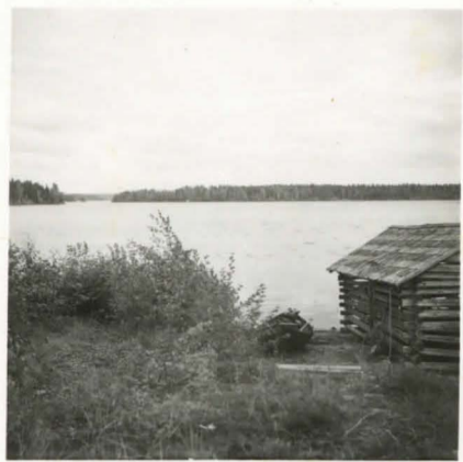
F.17675. Vilppula, Huopionniemi. Kuvassa oikealla näkyvä pitkä saari on Kasilansaari. Saviastian löytöpaikka saaren vastakkaisella rannalla.