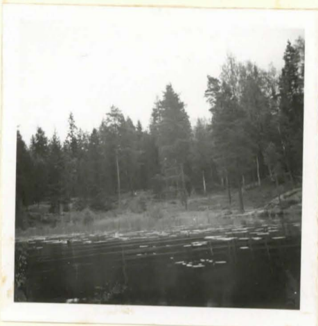
F. 17676. Kasilansaari. Valkama, jonka perukasta saviastia löytyi.