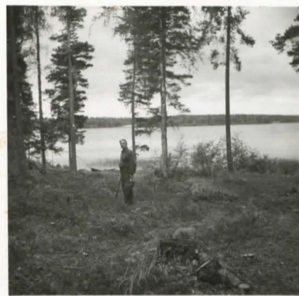
F. 17677. Kasilansaari. Näköala valkaman perukasta järvelle.