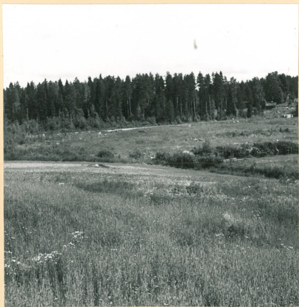
Asuinpaikka kuvattuna lännestä.