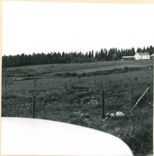
Asuinpaikka kuvattuna poikkeusesta. Jokelan talo on kuvan oikeassa reunassa.