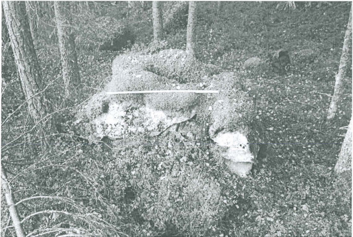
Takaosan savuaukon edessä metrin mitta.