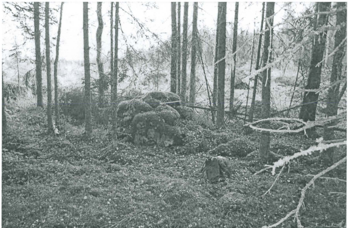
Yleiskuva kaakkoon. Kuvassa valkoinen metrin mitta.