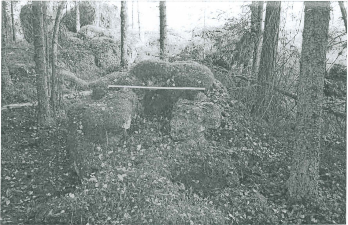
Suuaukon romahtaneen katon kohdalla metrin mitta.