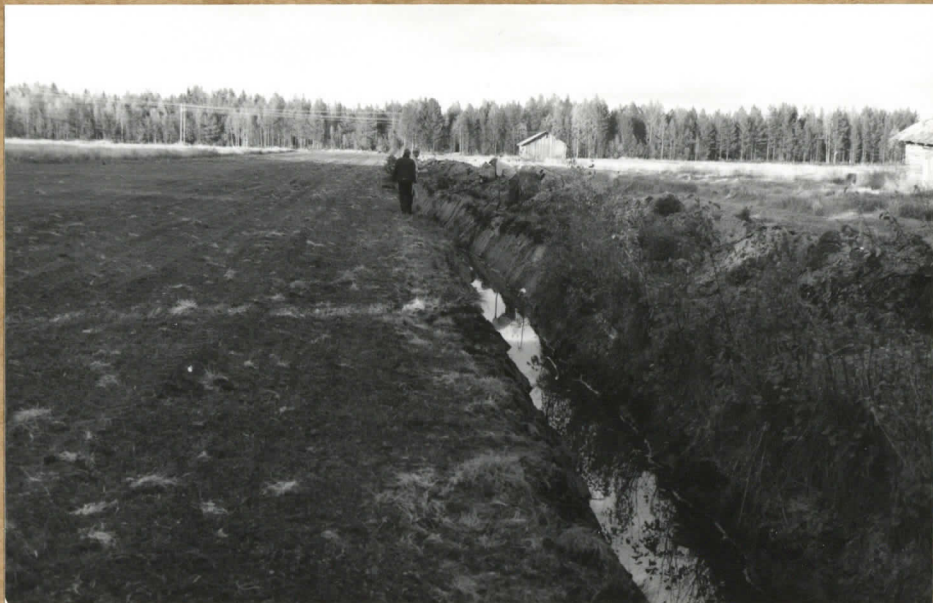
1. Yleiskuva Korvalan pellolta. Puita löytyy keskellä olevasta ojasta sekä taustalla näkyvän ladan kalliispuolelta kirkkivasta ojasta. SSW-NNE. F. 84077