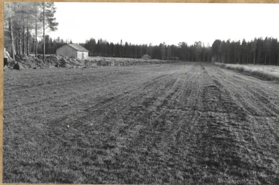
2. Yleiskuva Korvalan pellolta. Puita löytyy ladan edessä kirkkivasta ojasta sekä vasemmalla näkyvän metsikön eteläpuolelta. NNE-SSW. F. 84078