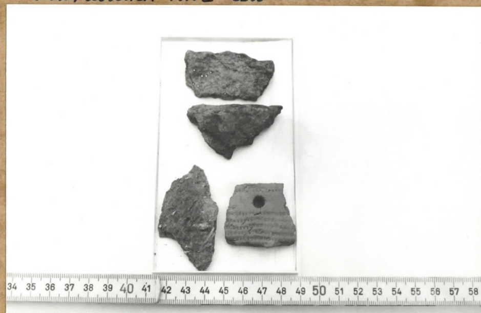
4. Saunastianpaloja, jotka ovat löytäneet korvalan uudisrakennuksen perustuksia kaivettaessa. F. 84074