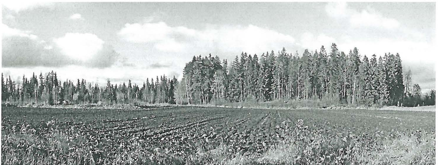
DG 10-42. Rahkonmäki tieltä kuvattuna. E-W. 12.10.2007 17.3