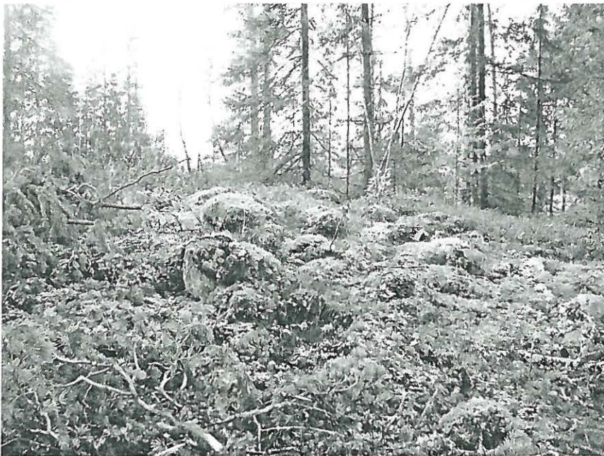
17.2 DG 10-41. Röykkiö harjanteen päässä. NE- SW.