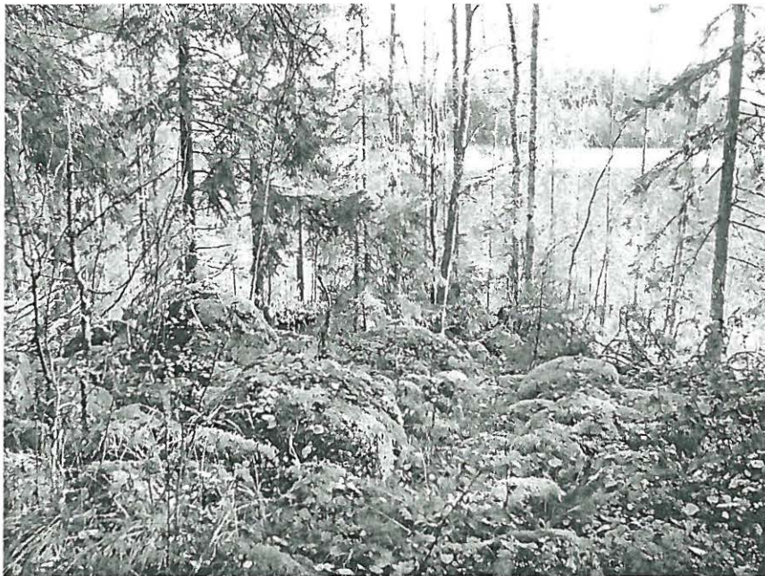
17.1 DG 10-40. "Röykkiö" Rahkonmäellä. NW-SE. 12.10.2007