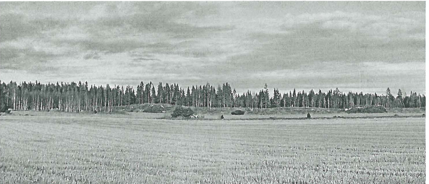
14-5 DG 10-35. Äestetty mäki, jolla asuinpaikkoja ja röykkiöitä. SW-NE. 17.10.2007