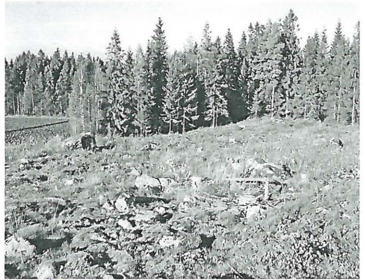
14-2 DG 10-32. Edustalla latomus, vasemmalla Kurkunmäen pohjoisii asuinpaikka ja metsän reunassa röykkiö. SE-NW..