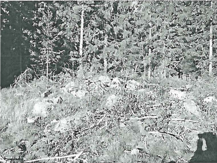
14-3 DG 10-33. Kiviröykkiö metsän reunassa. S-N. 17.10.2007