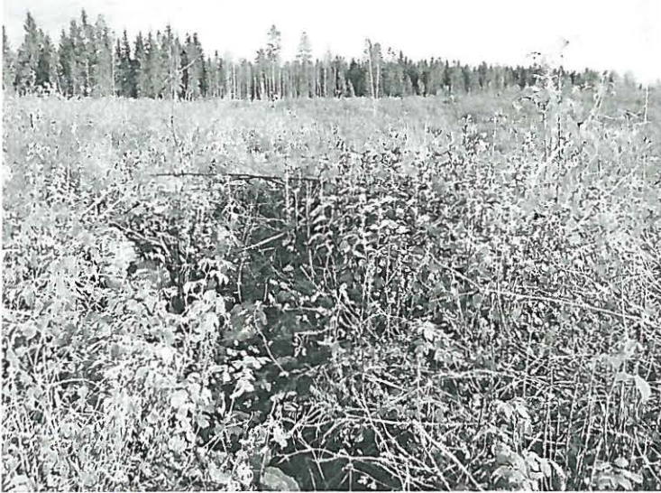
14-1 DG 10-31. Mahdollisen röykkiön kiveystä äestysvaossa, maakivi puskien alla. SW-NE.