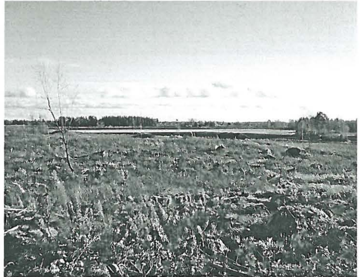
14-4 DG 10-34. Asuinpaikka mäellä ja rinteellä. NW-SE. 17.10.2007