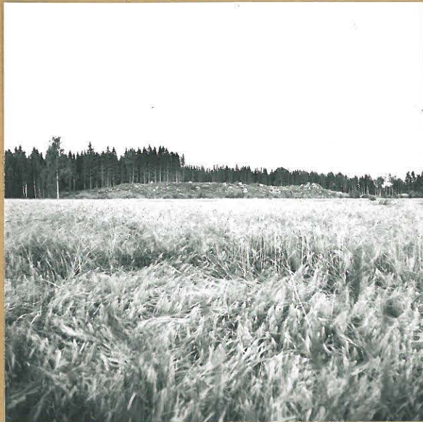
PELTOISTENMÄEN POHJOIS- OSAA NIISTÄ TIELTÄ.