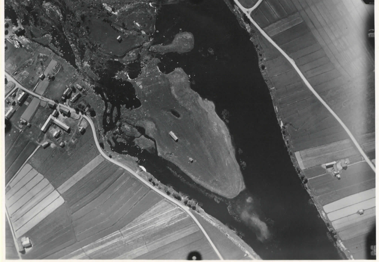
P/88/K VÄHÄKYRÖ, HIIRIKOSKI 63°21'-2"48' 15.6.37/10.30 25/1000 PALONPERÄ ↓