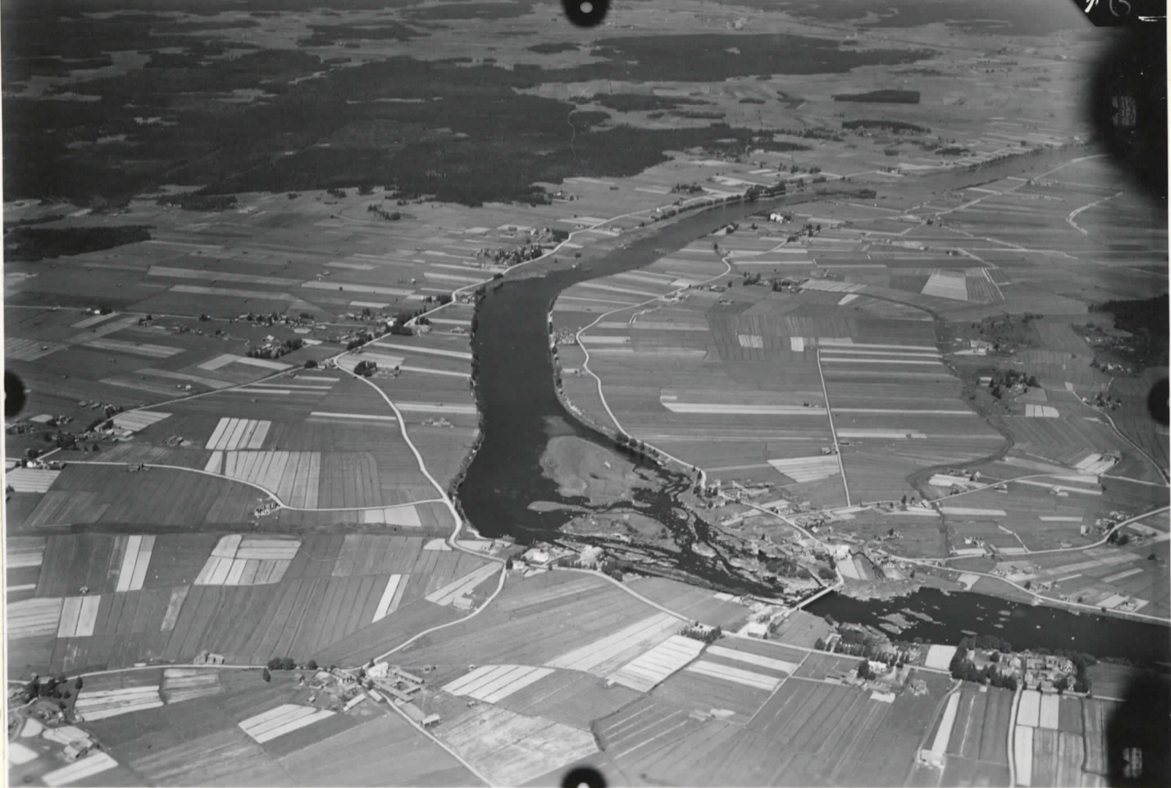
V/276/K VÄHÄKYRÖ, HIIRIKOSKI 63°21'-2"48' 15.6.37/10.06 25/800 PALONPERÄ 16