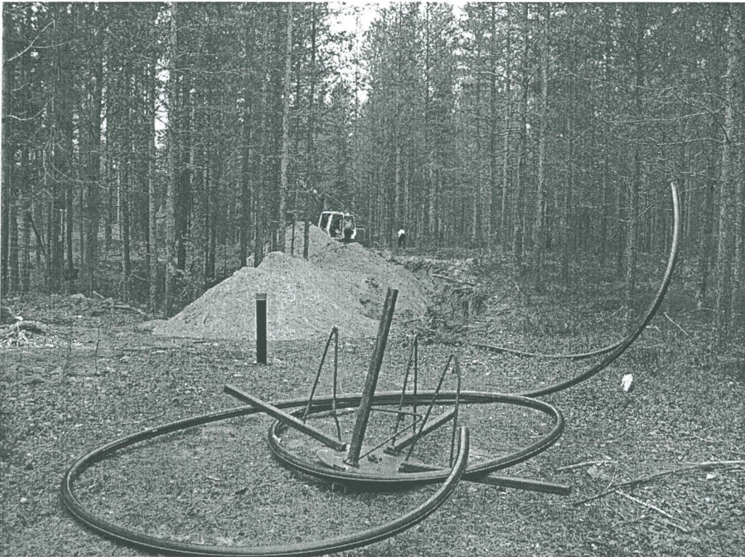
Viemäriin kaivua poikki kankaan kohti pohjoista

Viemärintöiden valvonta 15.6.2007