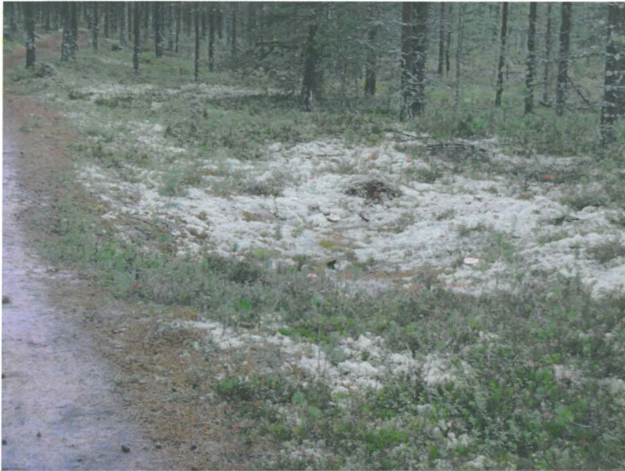
Kuva 7. Asumuspainanne aivan polun vieressä.