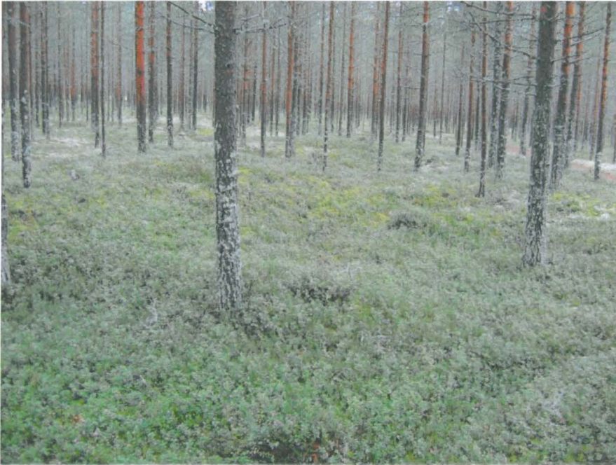
Kuva 1. Asumuspainanne Rekikylän asuinpaikalla.