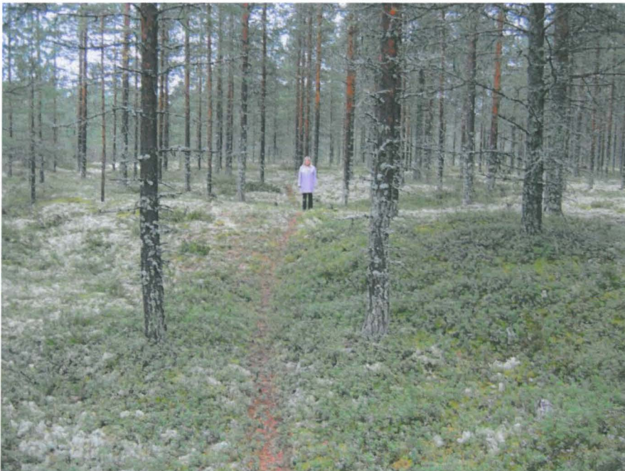
Kuva 4. Sirpa Leskinen seisoo asumuspainanteessa.