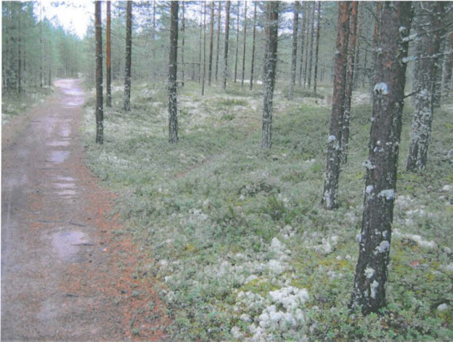
Kuva 3. Asuinpaikan alaosan halki kulkevan polun varrella on asumuspainanteita.