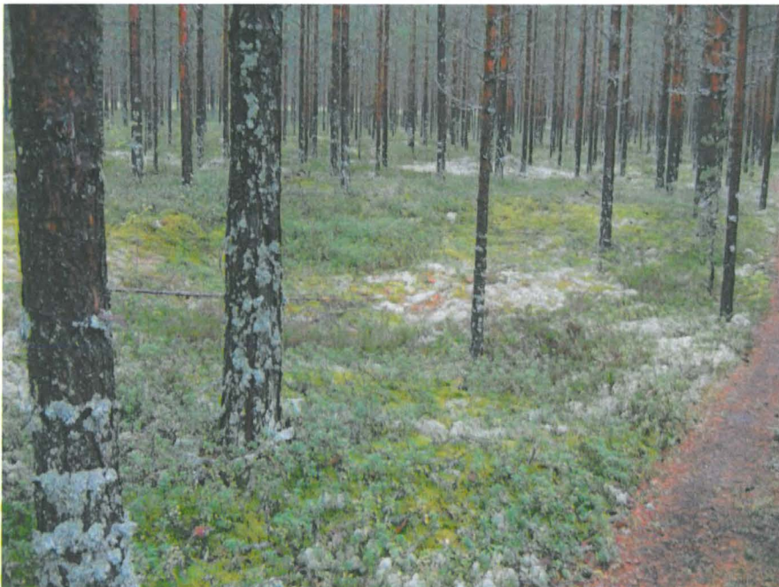
Kuva 8. Asumuspainanne polun varressa.