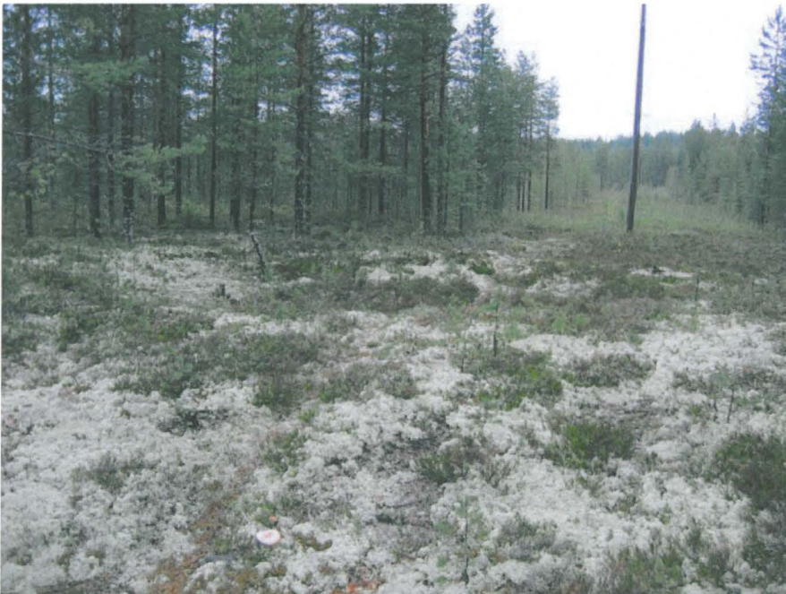
Kuva 2. Näkymä sähkölinjalta suolle päin.