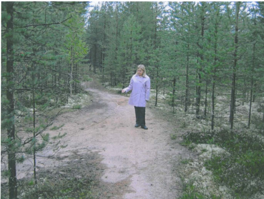
Kuva 6. Polun pinnalta löytyi piitä ja kvartsia.