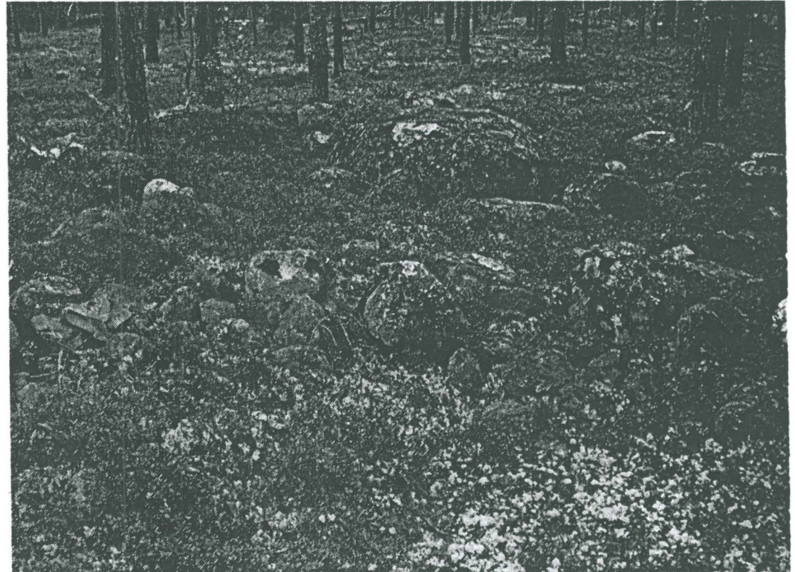
Ylivuotolla kärjäkivet ovat muuttuneet osaksi metsää. Mukana on oltava opas, joka tietää paikan.

Kivet on aseteltu rinkiin, jonka sisällä toisessa laidassa on suurempi kivi, varaskivi. Ringistä on ilmeisesti aikoja sitten siirretty joitakin kiviä pois.