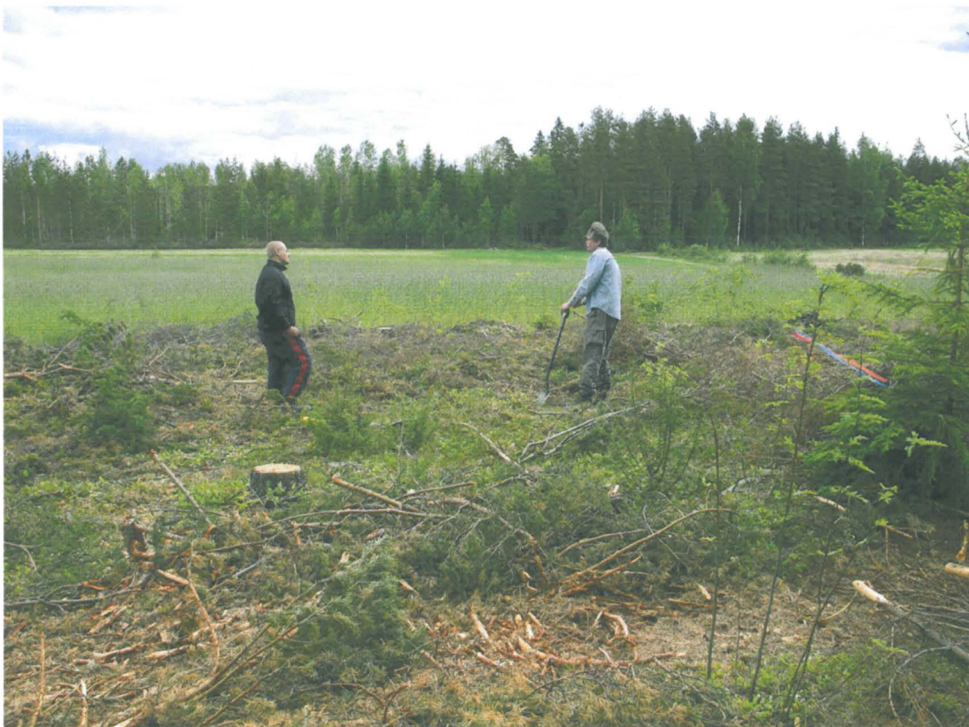
Kuva 2. Koekuopan kaivuuta.