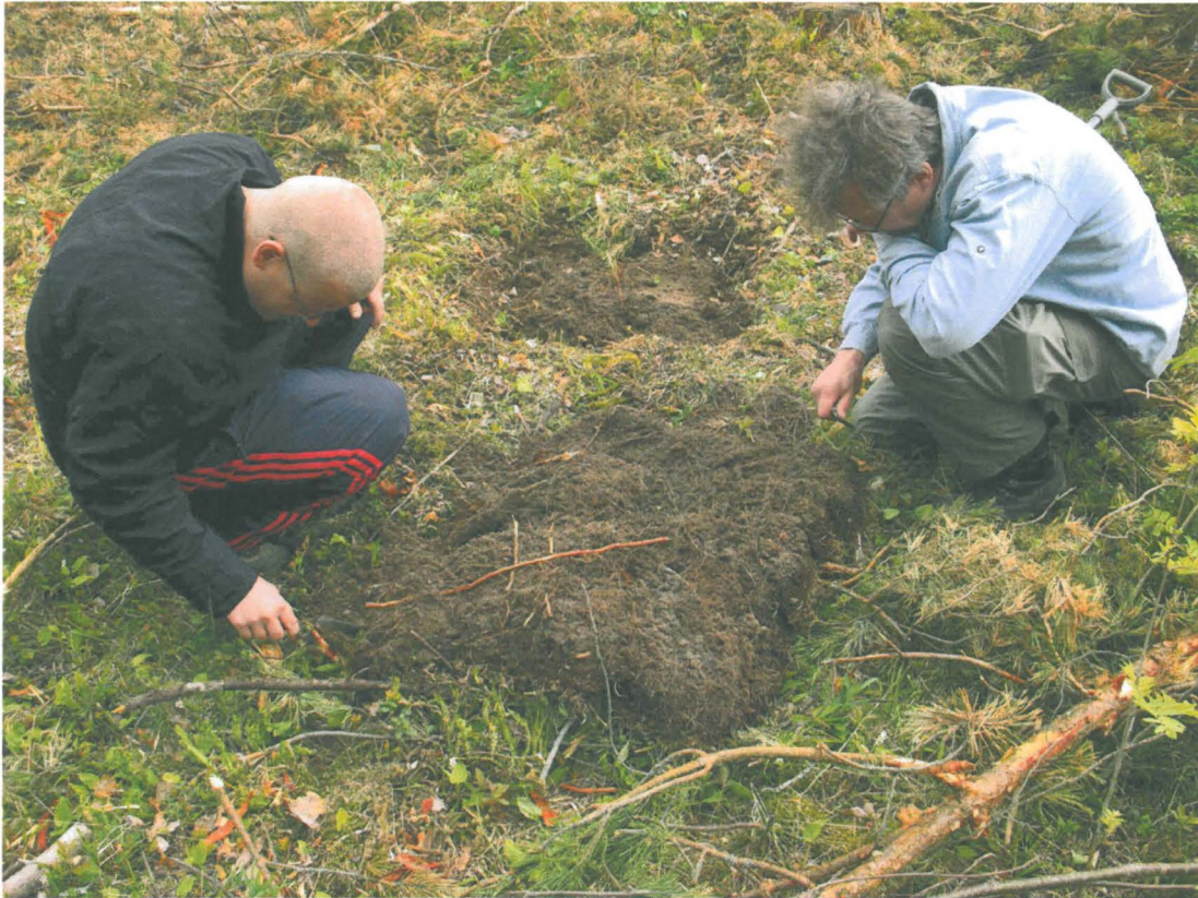
Kuva 3. Koekuopan pintaturpeen tarkastus.