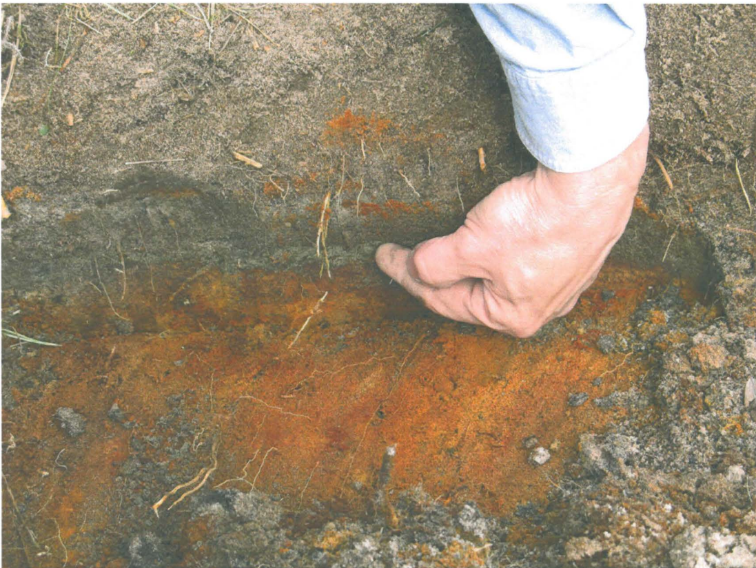
Kuva 4. Tummassa sekoittuneessa kerroksessa oli näkyvissä ohuita savijuovia. Tämän kerroksen alta alkoi punertava, hyvin rautapitoinen hiekka.