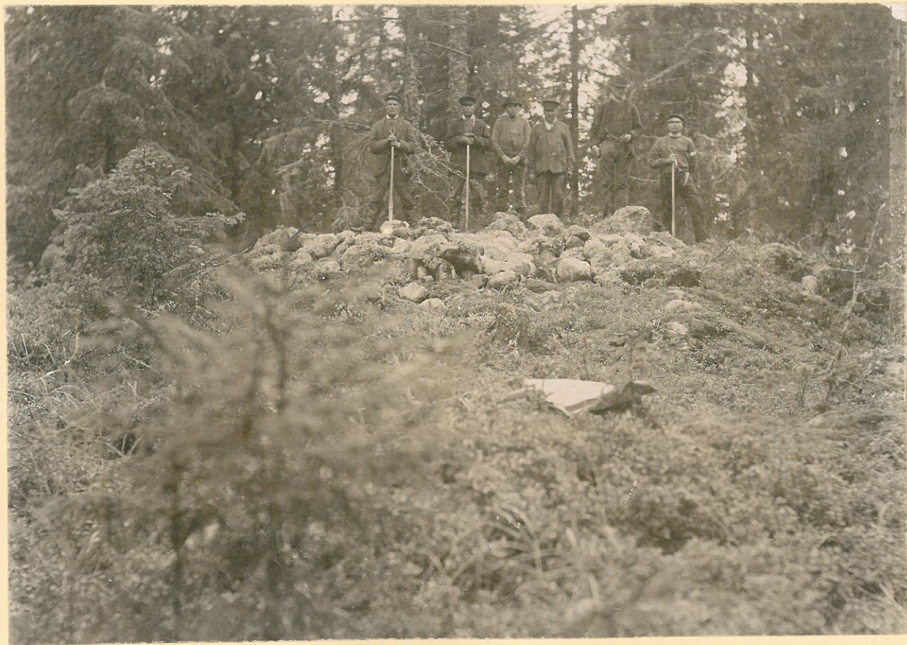
Lillkyrö s:m, Tervajoki by. Ett stenröse på Peltoistenmäki, juli 1894.