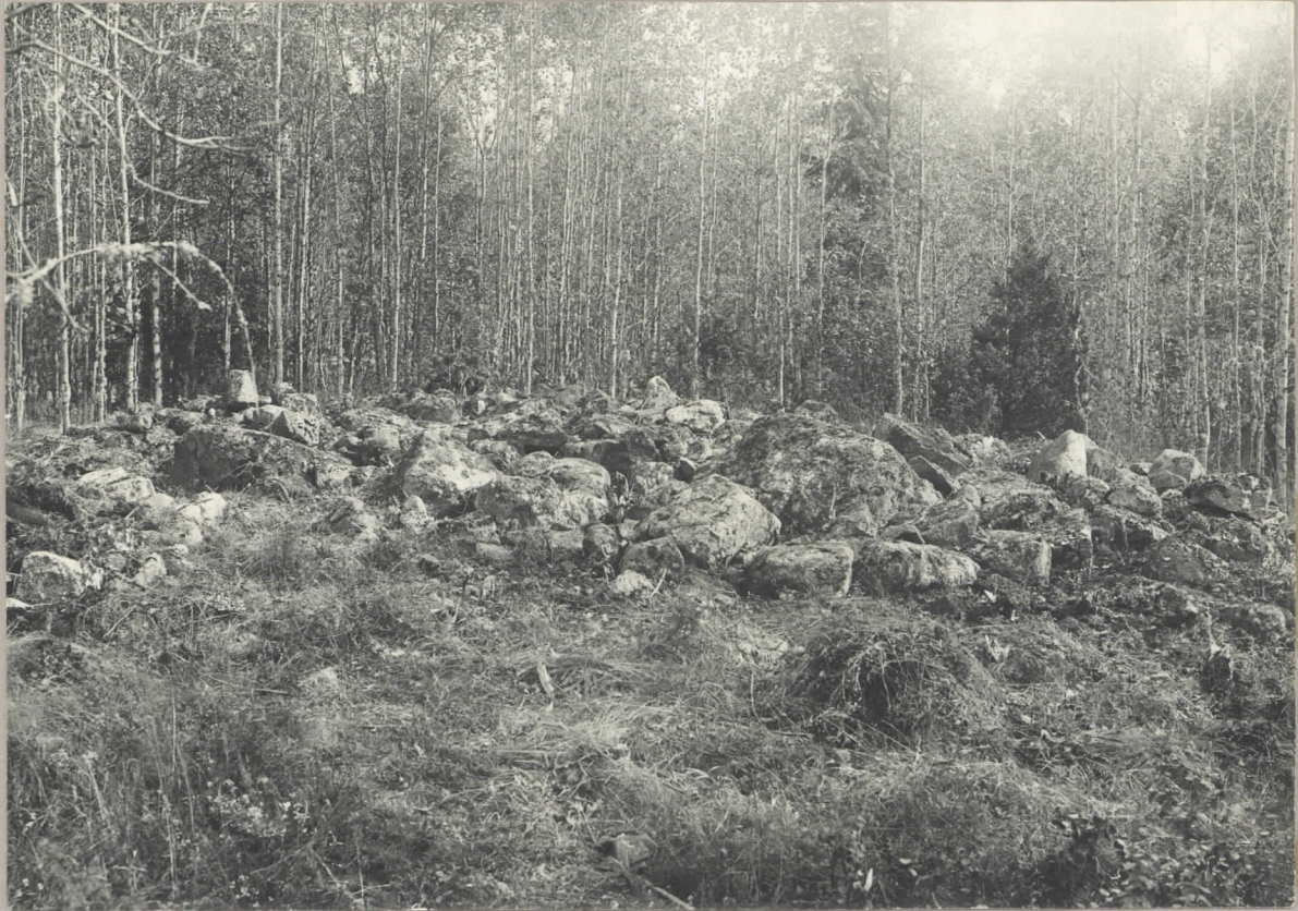
Röset n:o 7 på Viskus backen, Mäkipää by, Vörå sin, undersökt sommaren 1931 av Jacob Tegen- gren (HM 4385). Till vänster synas några kantstenar av det år 1930 undersökta röset n:o 6.