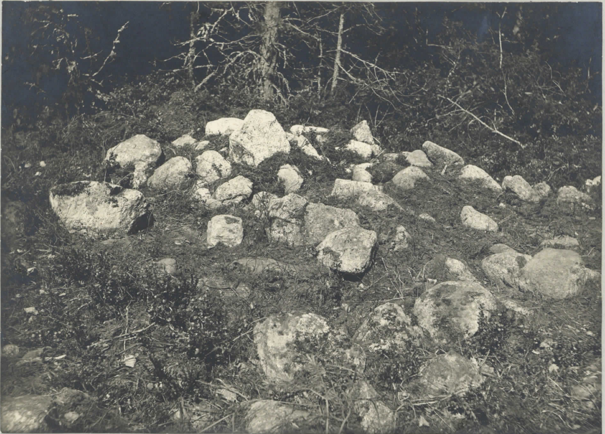
Laggpeltkangas. Röse n:o XVIII 1928.