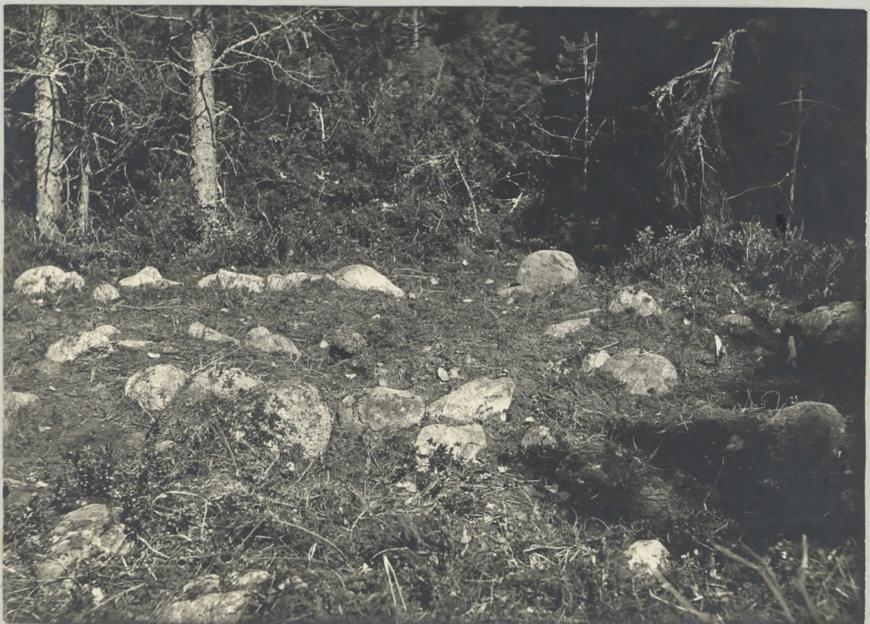
Laggpeltkangas. Röse n:o XIX 1928.