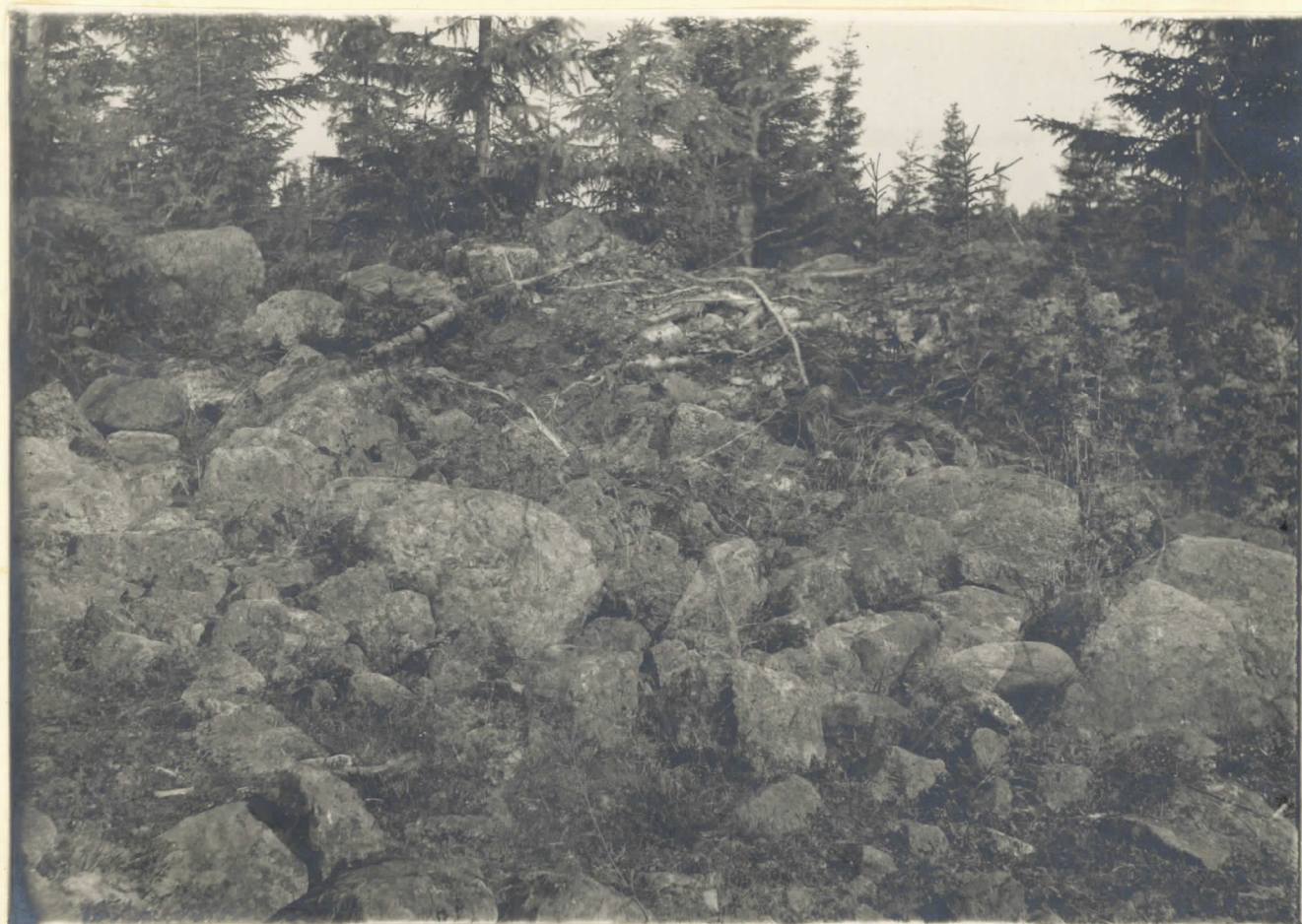
Plåt nr 6058. Stenröse invid Slögs hemmans äbyggsvader i Lotleko by.