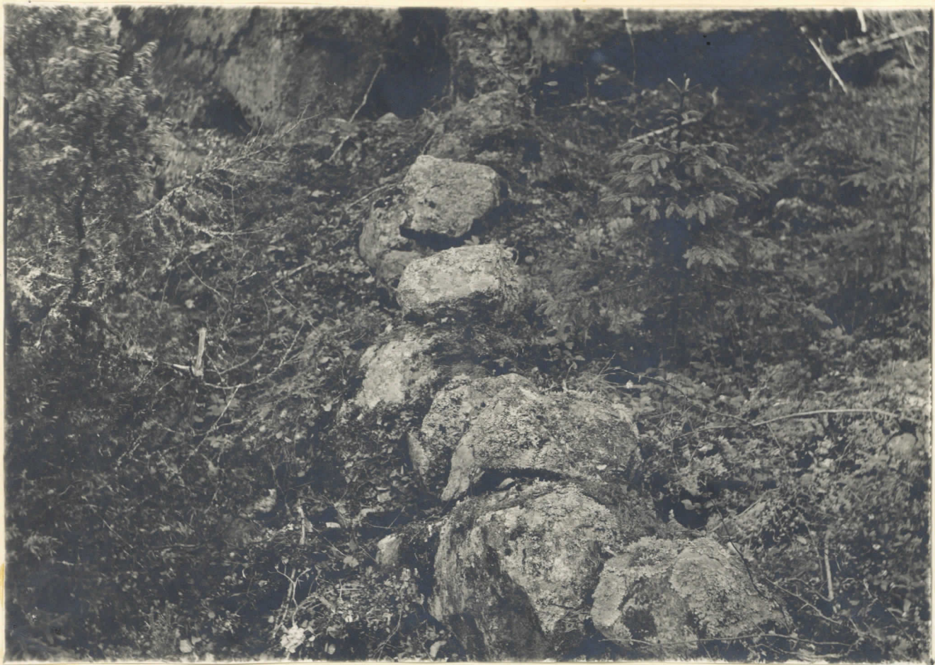
Pl. nr 6064

Del av en stensättning i Anders Ohlss hemmans skog, Lom- by, 5100 m Örn Nyjords Minne och 100 m S om Stämavägen. I fic- grunden den på vidsträckt karta med rött blått betecknad stensallen.