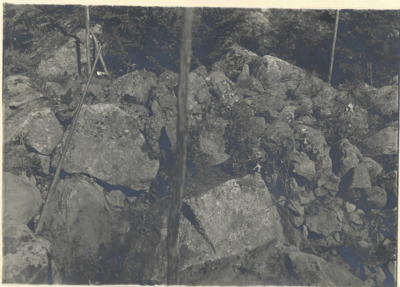
Plåt nr 6059. Samma röse under pågående undersökning.