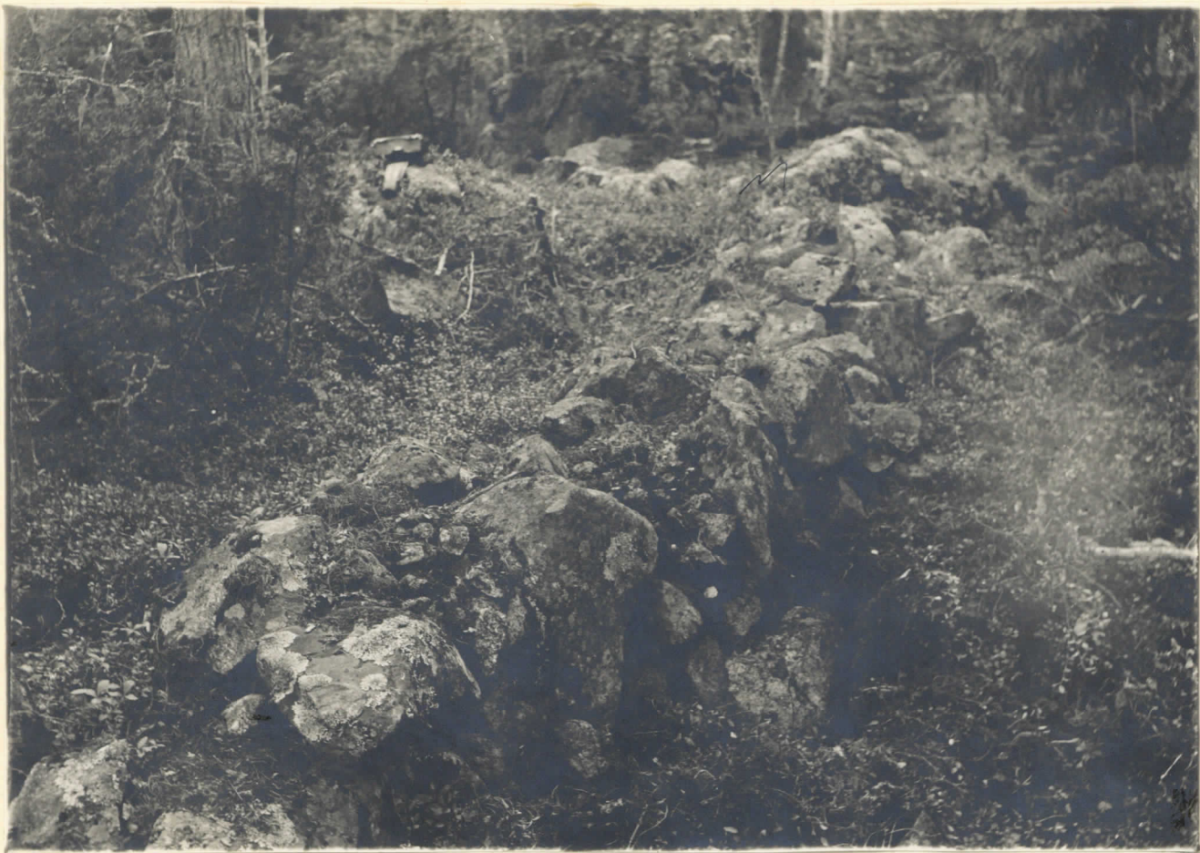
Pl. nr 6063