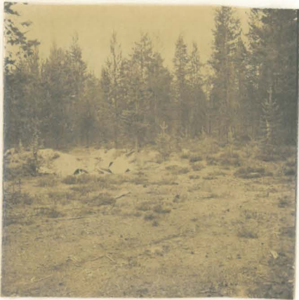
Kuva 2 ( f. 54828 )