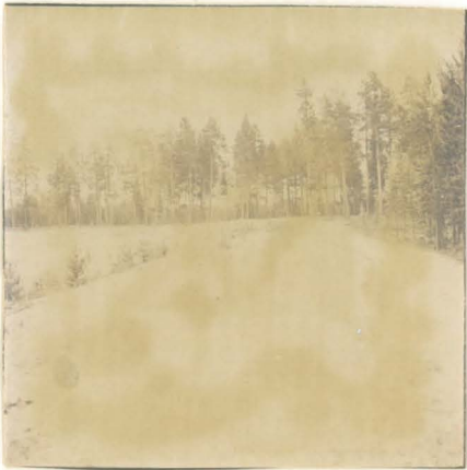
Kuva 1 ( f. 54827 )