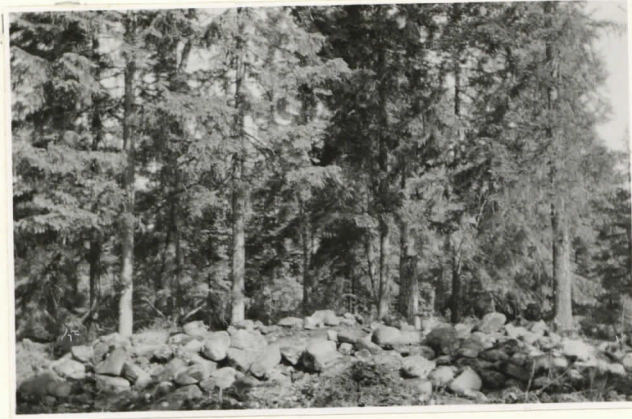
1. Rösen N o 2, sett t från söder