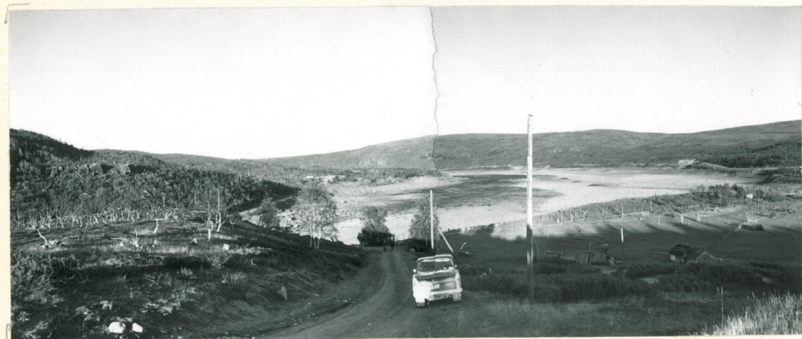
41509 Valokuvat 3-4 9:1