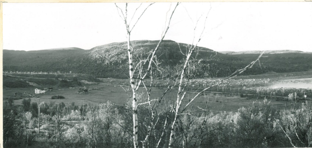
41511 Valokuvat 1-2 9:3