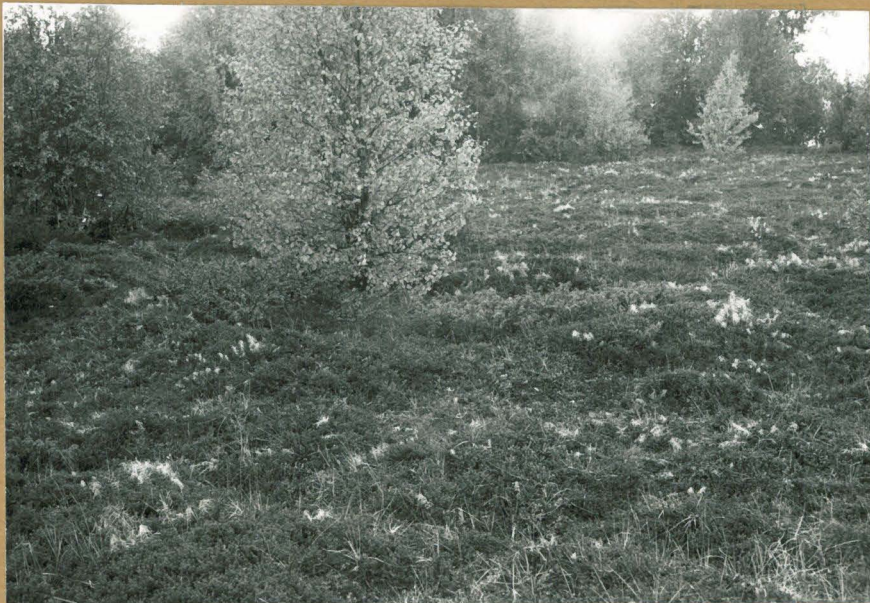
6. Kodausstig rantatasanteelle pihapuusta länteen, idästä. +70328