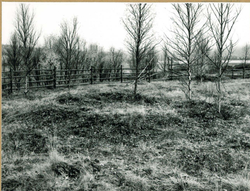
4. Kodauslaj n:o 8, lounaasta. †70306