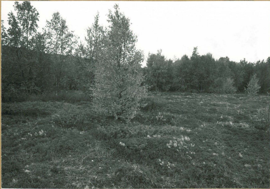
5. Kodausstig rantatasanteelle pihapuusta länteen, idästä. +70327