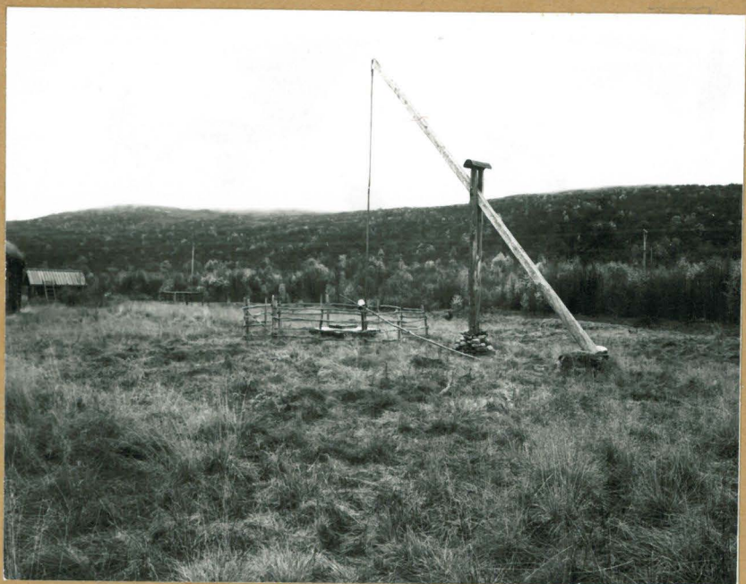
2. Kodauslaj n:o 2, mekesta. +70302