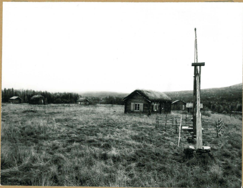
1. Yleiskuva perhasta talvot- +70304 tuna, kaakosta.