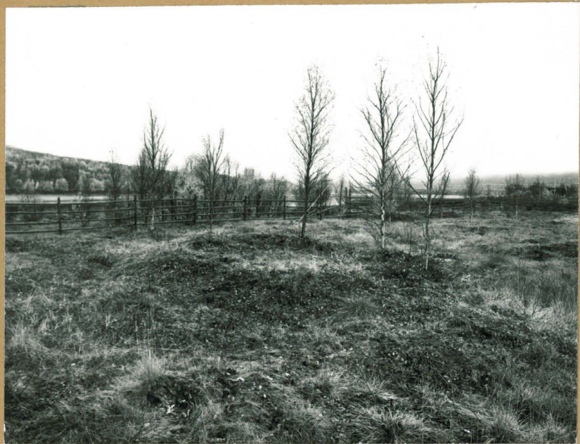
3. Kodauslaj n:o 8, lounaasta. †70305