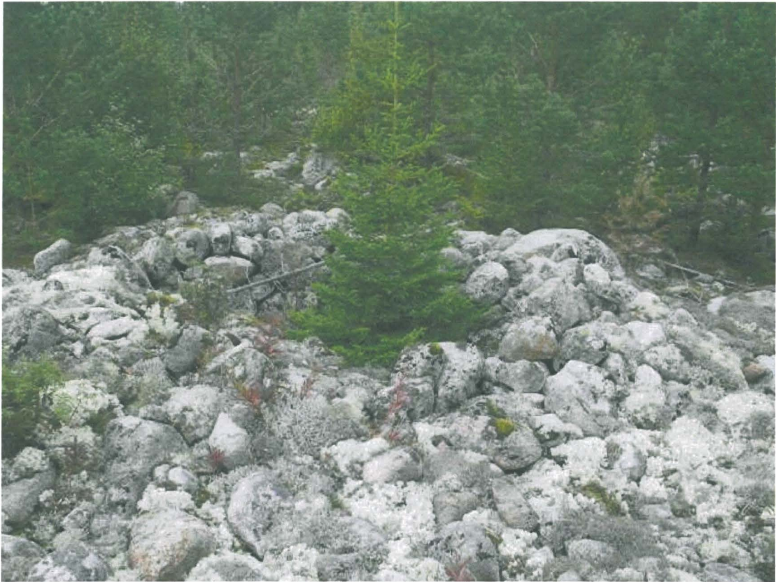
Kuva 1. Kivikkoon kaivettu kuopanne, jonka keskellä kasvaa kuusi.