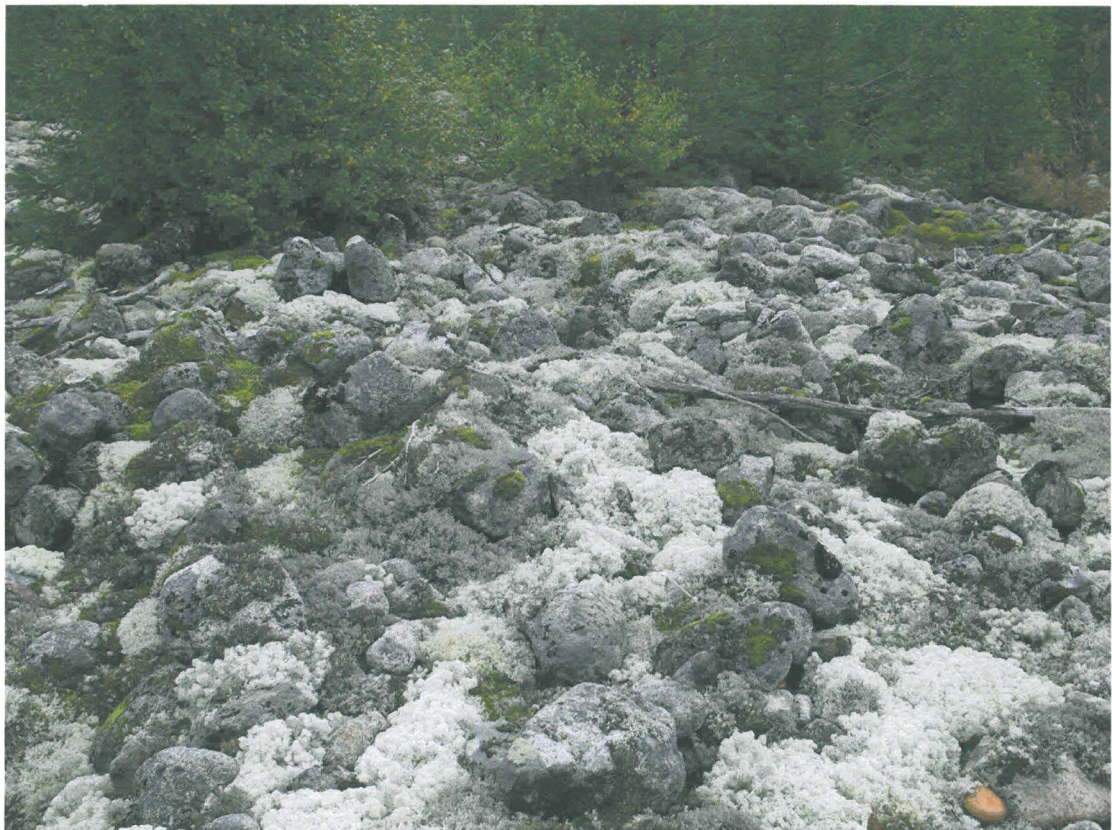
Kuva 4. Lakialueen kivikkoa, jossa painanteita.