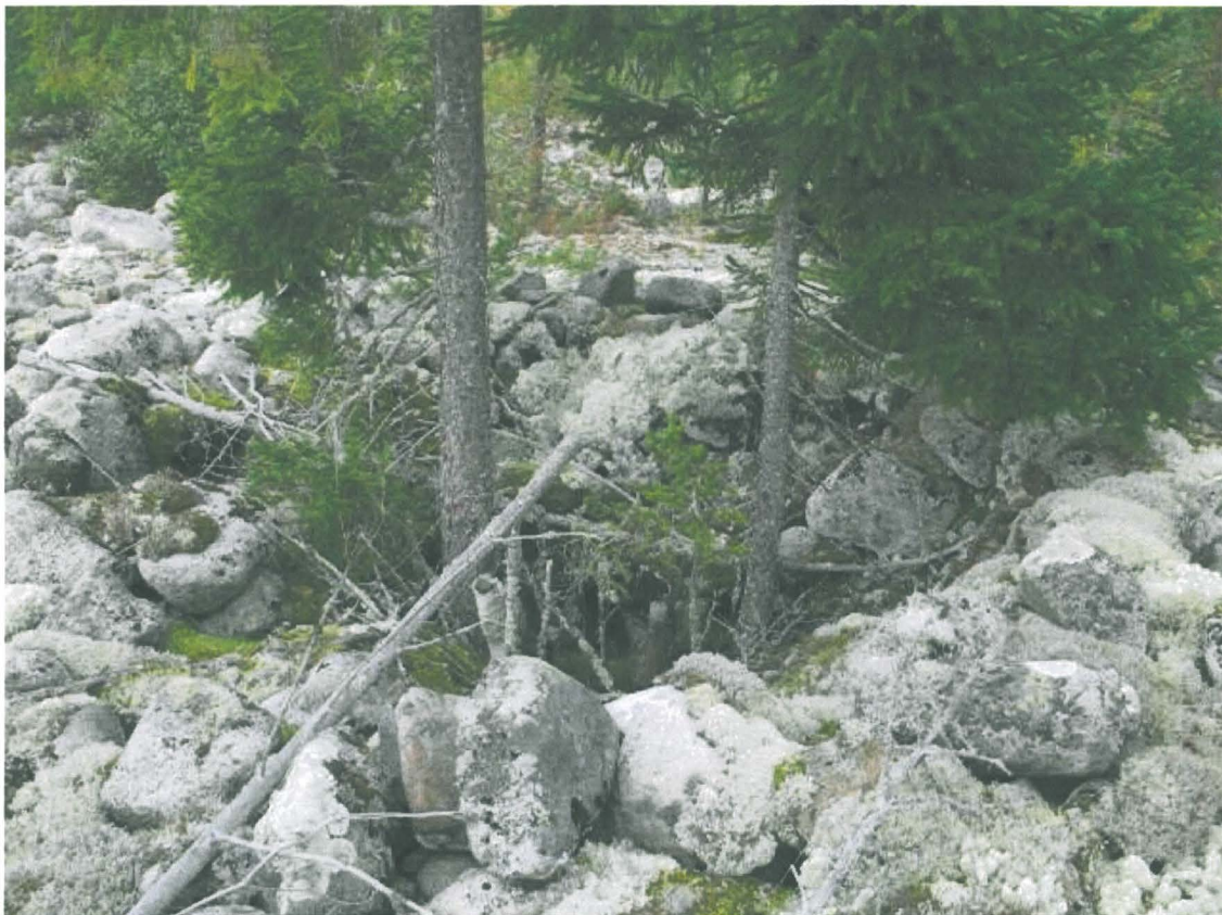
Kuva 2. Kivikkoon kaivettu kuopanne.