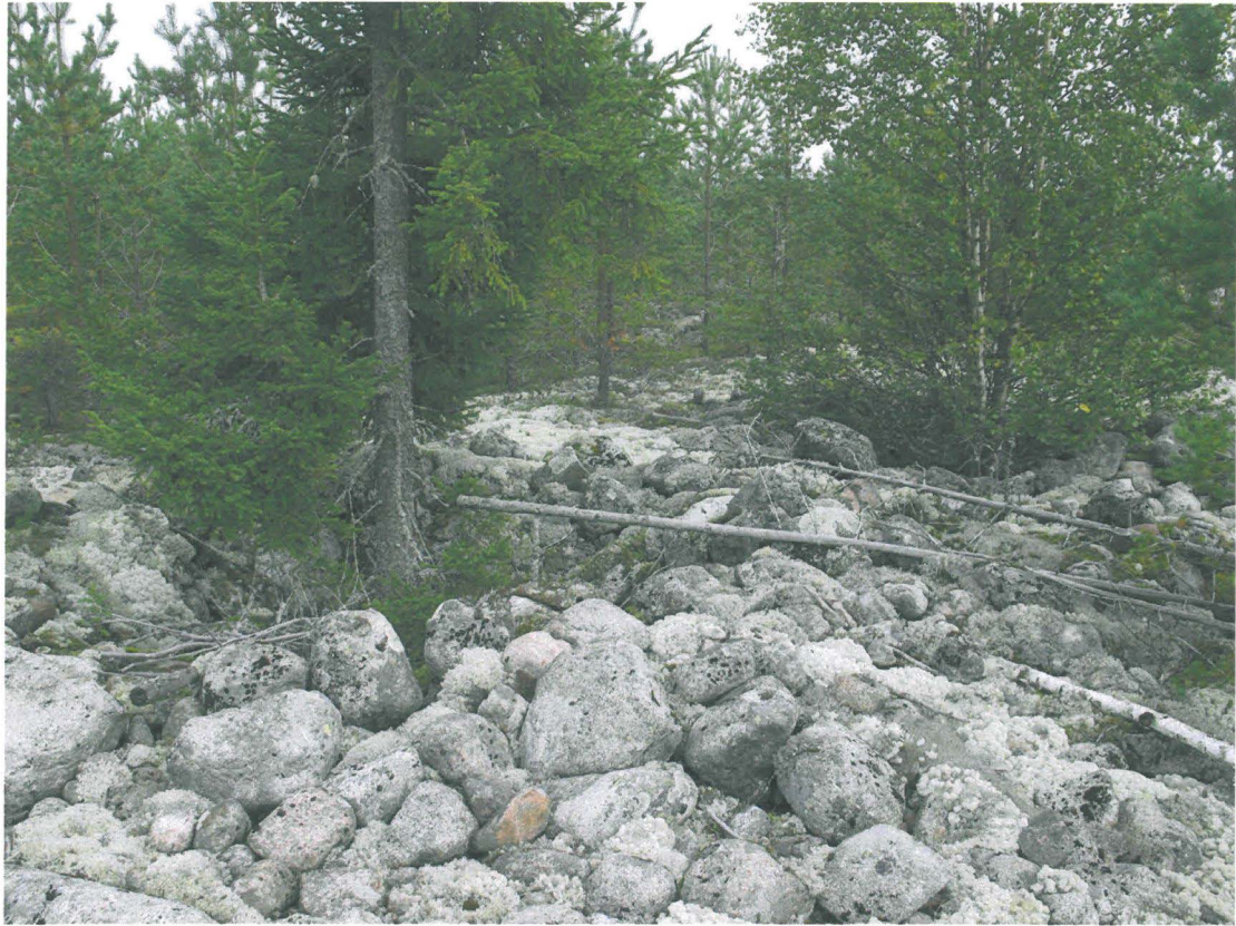
Kuva 3. Kaksi kuopannetta peräkkäin; toisessa kasvaa kuusi, toisessa koivu.