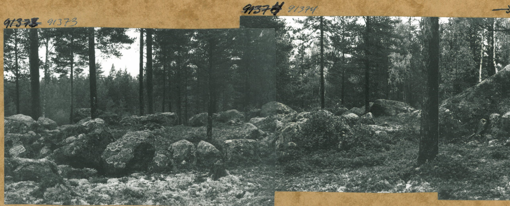
PANDORAAN KIVIKONKÄEWÄ OLEVISTA RAIVANTEISTA JA KIVIPIVETSTÄ, JA BÖYKELLIÖISTÄ