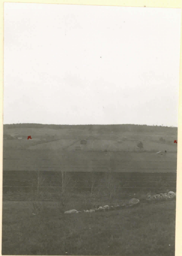
lev. n:o 9692