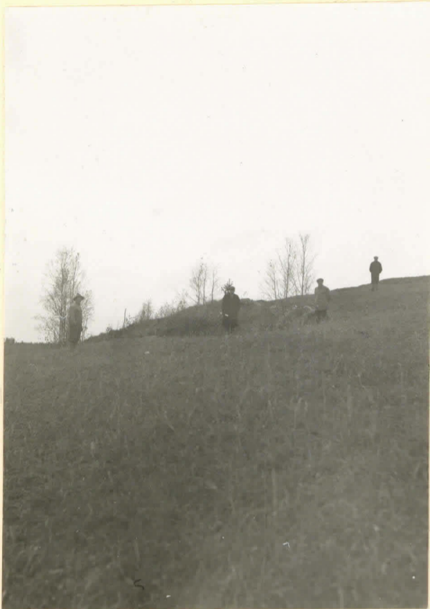
lev. n:o 9691