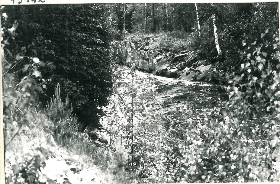
HÖJFORSEN, KOSKEN NYKYI- IVEN, KALLIOON HAKATU VOMA, VAS PENSIIDENTAKANA MYLLYN RAUNIOIT(SAHAN?)