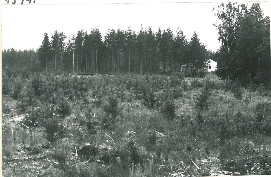
ASUINPAIKKAA NIEHEN KESKI-VAIHEILTA HÖJFORSENIN TALOA PÄIN, KAAKOSTA