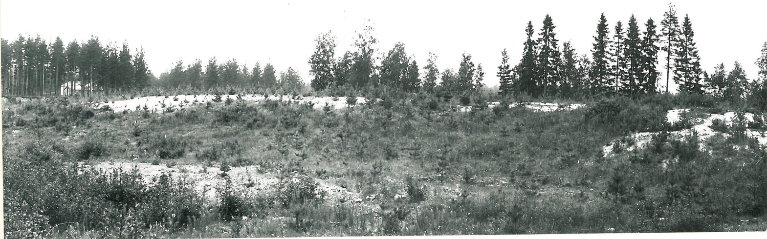
ASUINPAIKKAA LOUNASTA, ETUALALLA VANHA, MAATUNUT HIEKKAKUOPPA, VAS. HÖJFORSEN TALO.