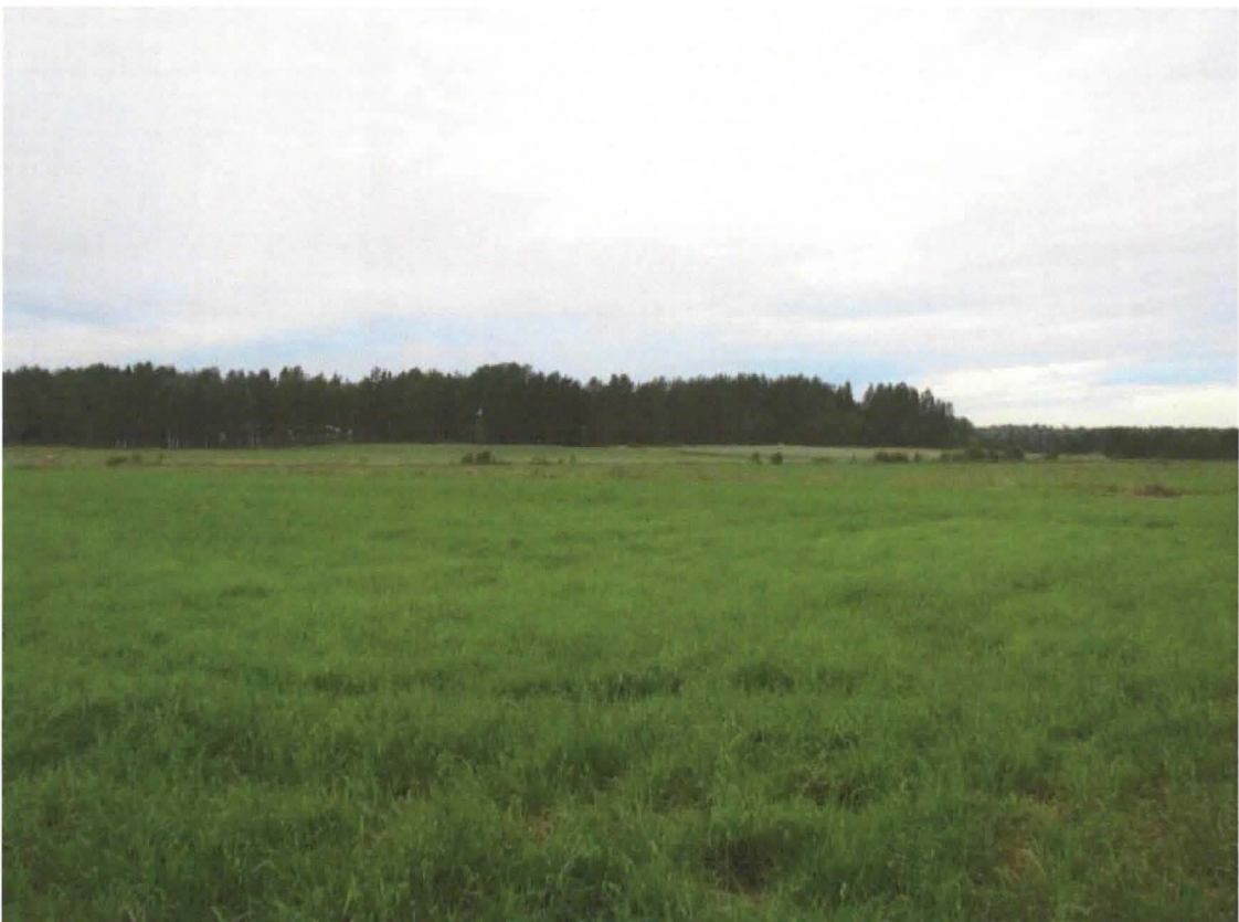
DG2091:2 Yleiskuva Troiharin asuinpaikasta. Idästä.