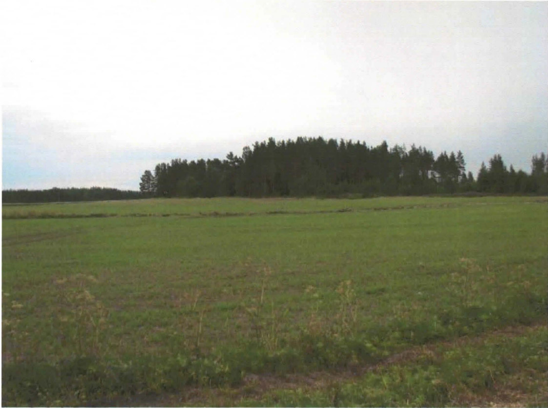
DG2091:1 Yleiskuva Troiharin asuinpaikasta. Pohjoisesta.