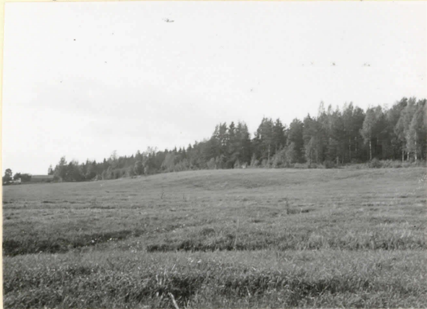
Espoo Kläppkärrer. Valokuva SO:sta päin. Levy 9545.