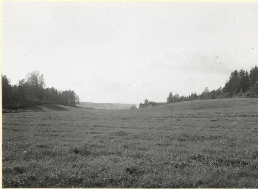
Espoo, Kläppkärrerin kivikaut. asuinpaikka. Löydöt oikealla ole- valta kummulta ja metsänreunasta. Taustalla suutari Levan- lerin rakennuksia. Levy 9543.