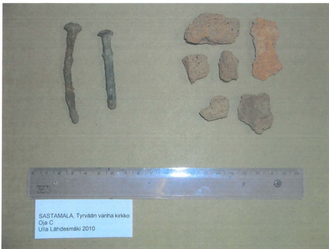
Sastamala, Tyrvään vanhan kirkon kirkkopihan tarkastus 2010. Kaapeliojan C (naulat) ja D (tiilenpalat) löydettyjä esineitä.