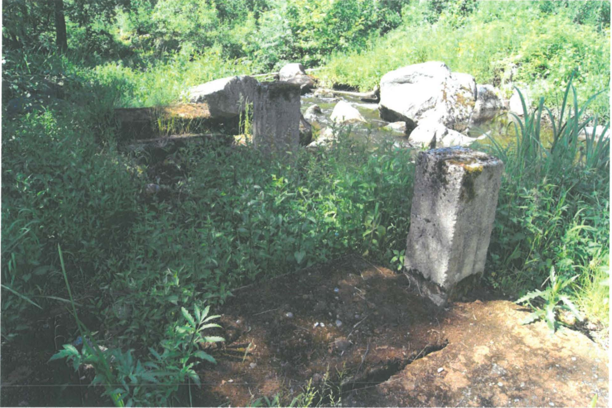
Kuva: Kyy 43:3 Betonilaattoja ja – pylväitä alajuoksulla.