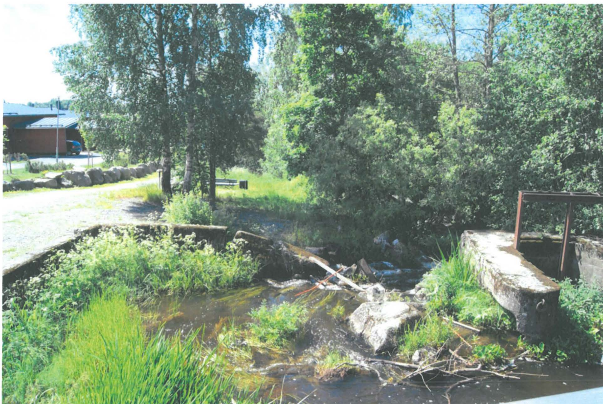
Kuva: Kyy 43:27 Allasrakennelma.