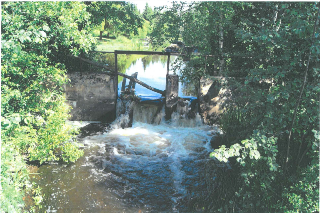
Kuva: Kyy 43:24 Yläjuoksun patorakennelma.