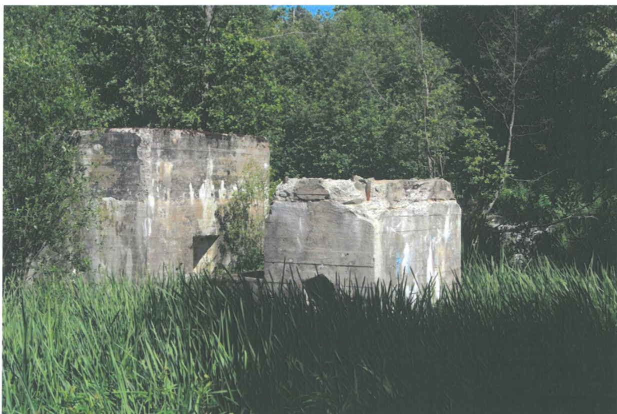
Kuva: Kyy 43:9 Betonirakenteita kokonaisuuden keskivaiheilta.