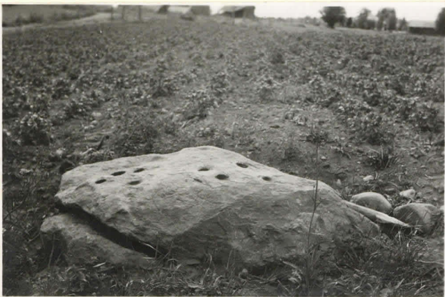
10. Uhrikivi idästä 11150