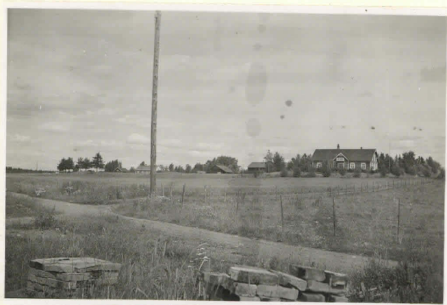
2. Ihalemmen Toukola 1142 etelästä päin