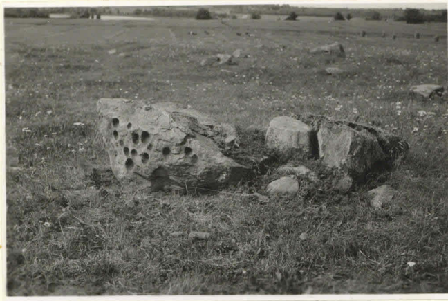
4. Uhrikiven pystyssä 11144 oleva osa, oikealla nimet lohkarat. itäpuolelta