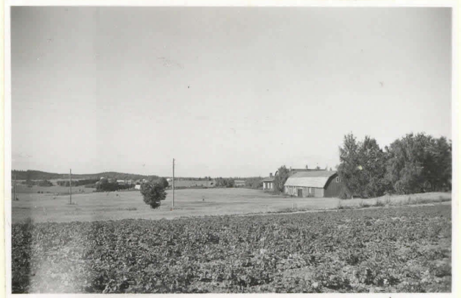
9. Savolan uhri. 11149 kivettä Lehijärvelle. Oikealla Toukolan talon rakennuksia ja kirkko. mäen itäosa, pohjoisesta