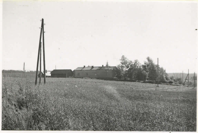
8. Savolan talon vanha 11148 päärakennus länsitornista uhrikiven paikka merkitty