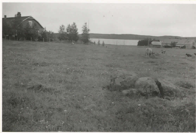
3. Sehiäni Ihalemmen Toukolan uhrikiveltä, pohjois koillisesta nähtynä. 1143