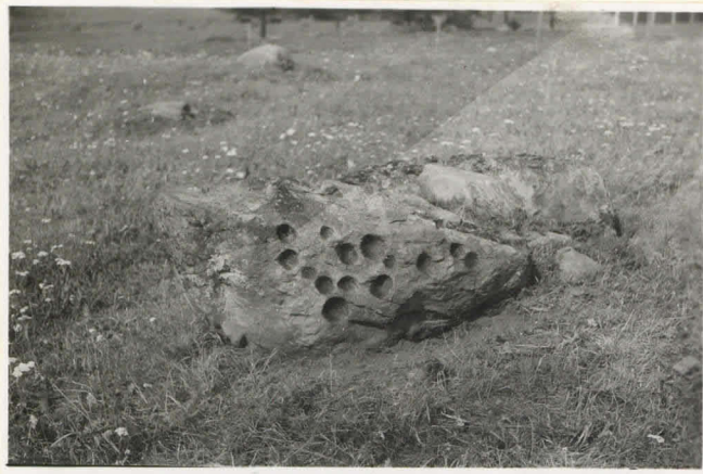
6. Pystyssä oleva loh. 11146 kare länsikaakosta