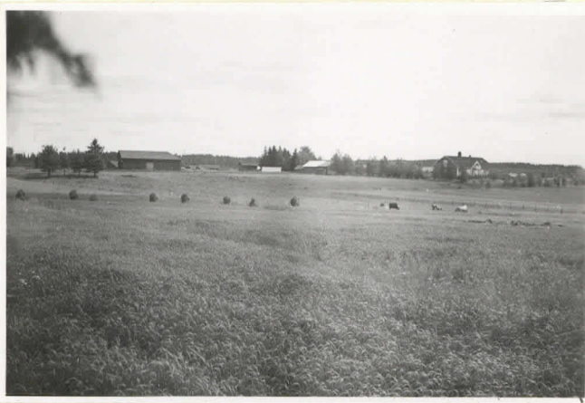
1. Ihalemmen Toukola 1141 oikella, keskellä Kirkkonäen saarekke. Toukolan uhrikivi merkitty kuva lännestä