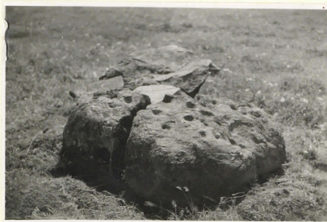
7. Pohjoiskoillisesta 11147