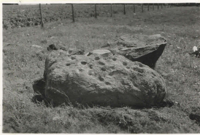
5. Suurin, alkuperäi 11145 sersä aremassa ollut osa länsipuolelta