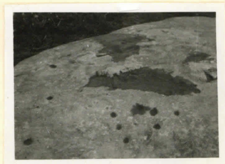
Talolan uhrikiivi koillisesta. Samaa kuppisryhmää kuin edellisessä.