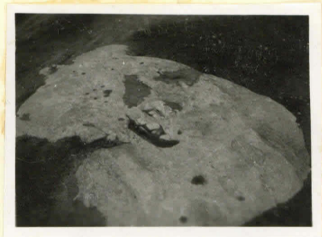
Uhrikiivi Hauholta Oberlain kylässä Talolan talon maalla, länsiluokasta nähtynä.