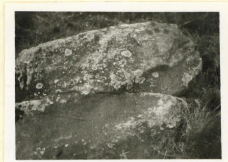
Jumilain uhrikiivi lännestä päin. Uhriluogat oikeassa yläkulmassa.