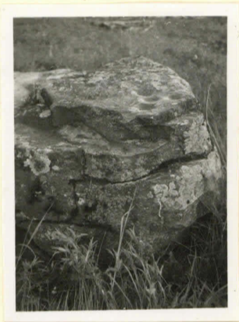
Jumilain uhrikiivi etelästä kään, uhriluogat päällä.