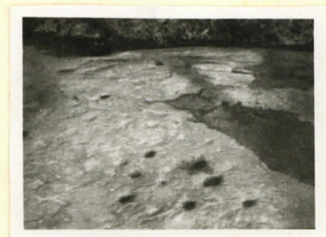
Talolan uhrikiivi pohjoisluokasta kuvattuna.