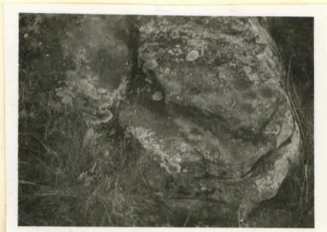
Jumilain uhrikiivi vinosta ylhäältä etelästä, uhriluogat oikealla.