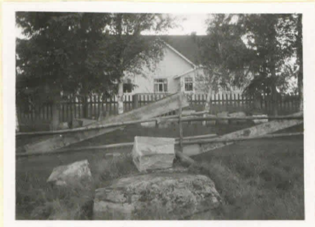
Uhrikiivi Hauhon Tivittulassa, Jumilain talon päävaikkunuksen edustalla. Kuvattu koillisesta.