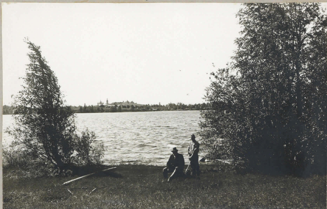
Flomantsi, Kirkonkylä, Kuisanniemmen talo Flomantsin järven rannalla. Valok. J. Silio 20/VI 1931.