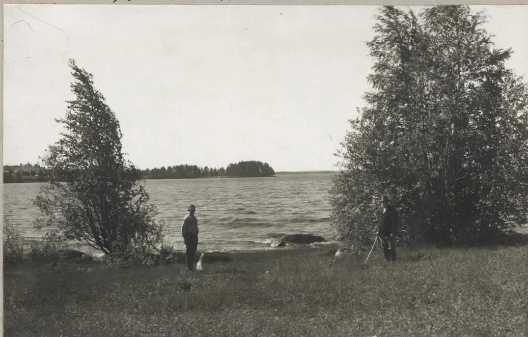
Flomantsi, Kuisanniemmen löytöpaikka (Kirkonkylä N), n.s. Ruukkiniemi, nähtävästi asuinpaikka Talok. J. Silio 20/VI 1931.