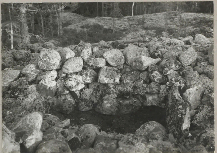
3. Kiviarkku erääs- sä Tuomaanmäen rau- nissa luoteesta päin.