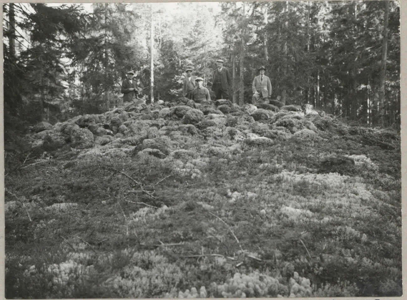
Kuva 1. Tuomaanmäen lounaisiin raunio läntes.