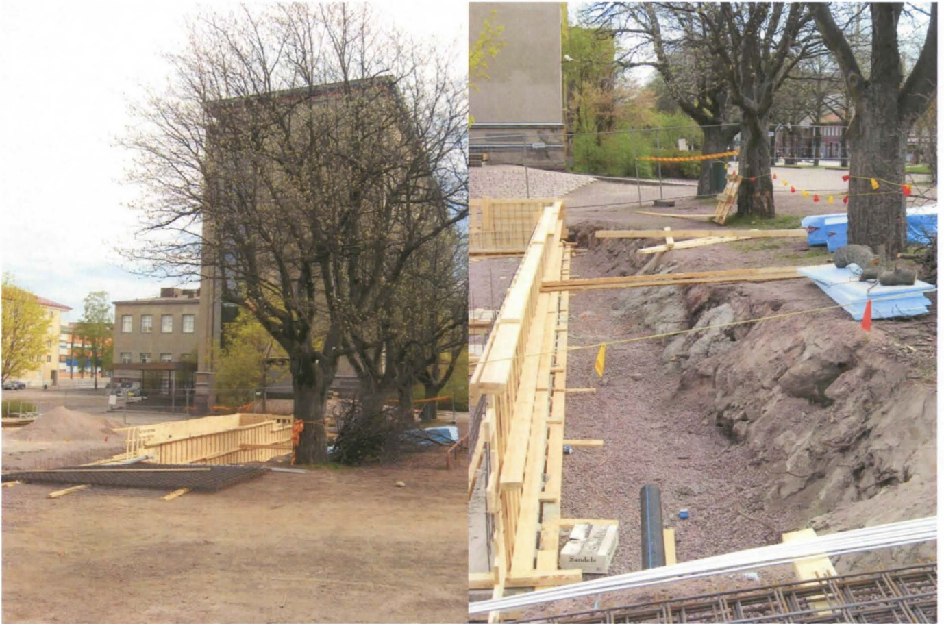
Kuvat 1-2: Vasemmalla rakenteilla oleva jätekatos puiden juurella (S) ja oikealla katoksen perustuskuopan SE-sivustaa (SW).

Paikalle rakennettavan jätekatoksen perustuksen valu- ja rakennustyöt olivat edenneet tarkastusajankohtaan mennessä jo pitkällä, ja rakennuksen pohja-ala oli peitetty 50 cm paksuisella sepelikerroksella. Tämän vuoksi ei alueen kerroksista ollut mahdollista tehdä havaintoja kuin ainoastaan katosta varten kaivetun perustuskuopan seinämistä. Se, minkälaista maa-aines perustuskuopan pohjalla oli, jäi olosuhteiden pakosta selvittämättä.