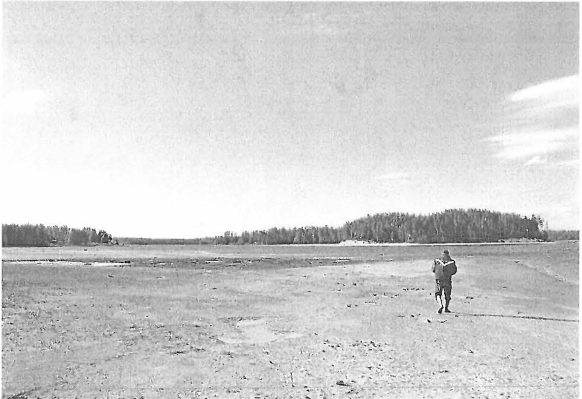
Kuva 1. Laivasaaren vedensyömyä pohjoisosaa. SE. KaiM 7683:2.