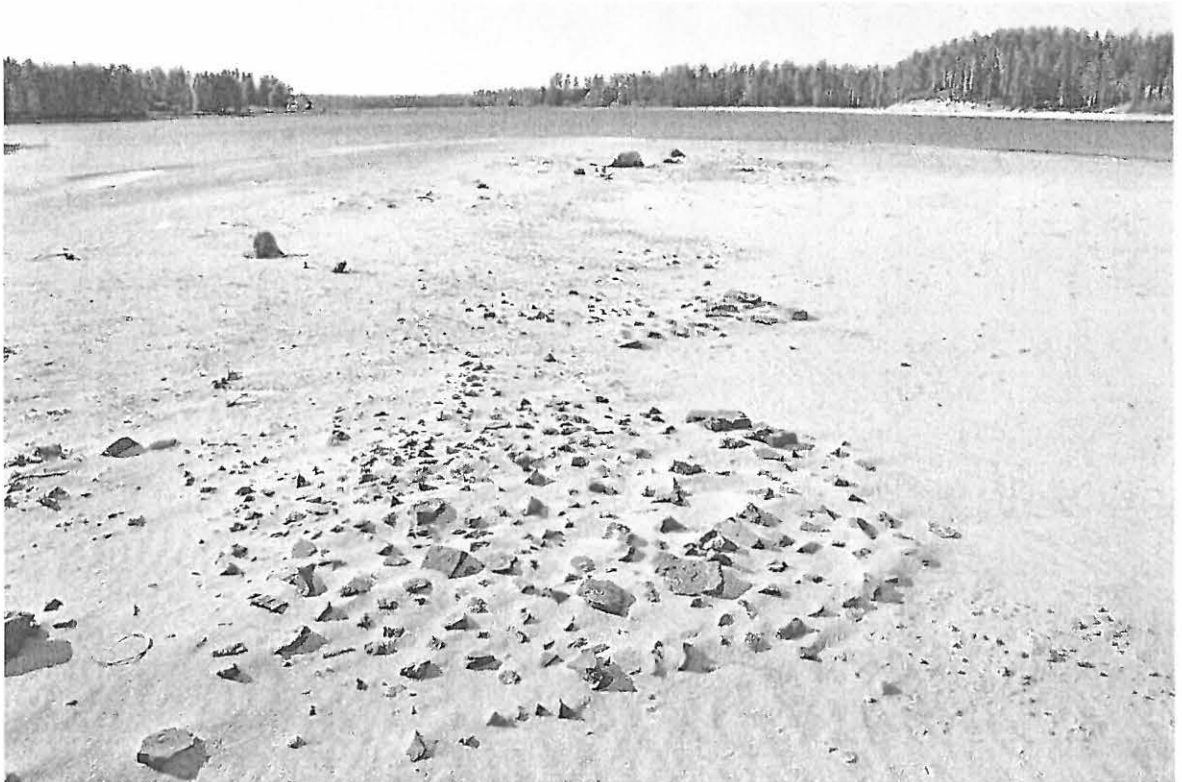
Kuva 2. Tulisijanjäännöksiä Laivasaaren pohjoisosassa. SE. KaiM 7683:3.