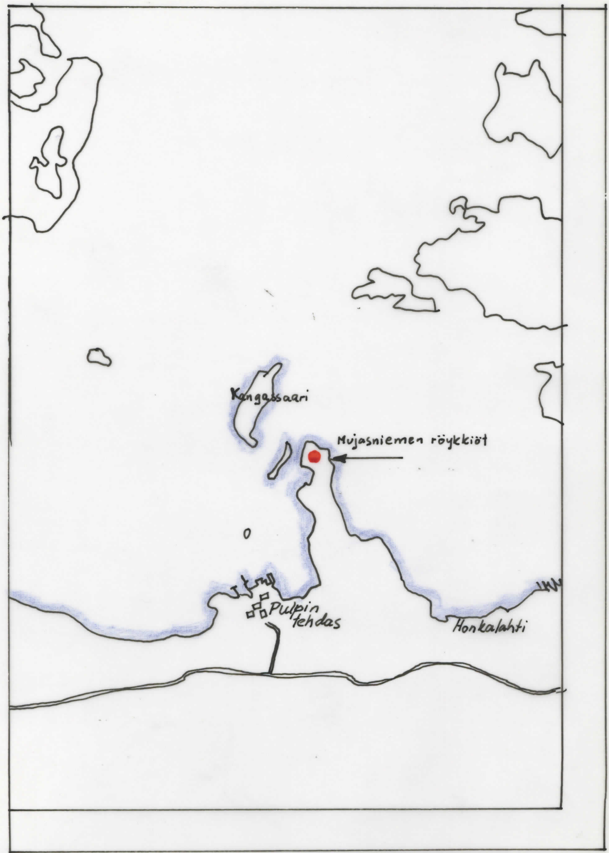
Peitepiirros 1:20'000 pit.kartasta, lehti KATTELUSSAARI (til.n:o 313411)