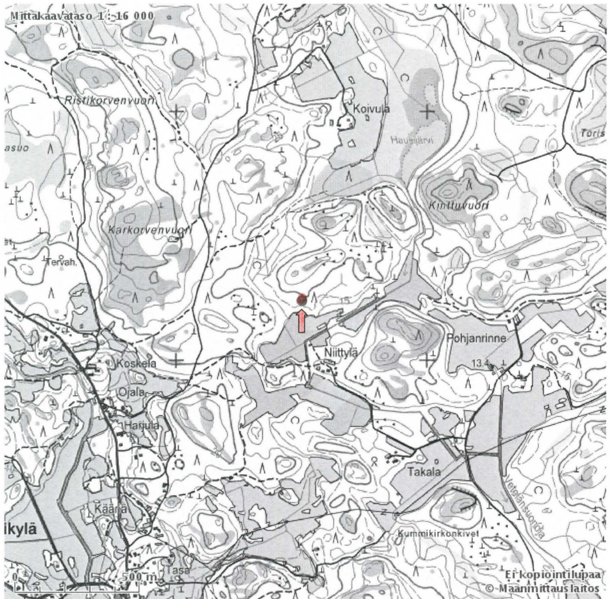
VIROLAHTI NIITTYLÄ Peruskarttaote 1:16 000