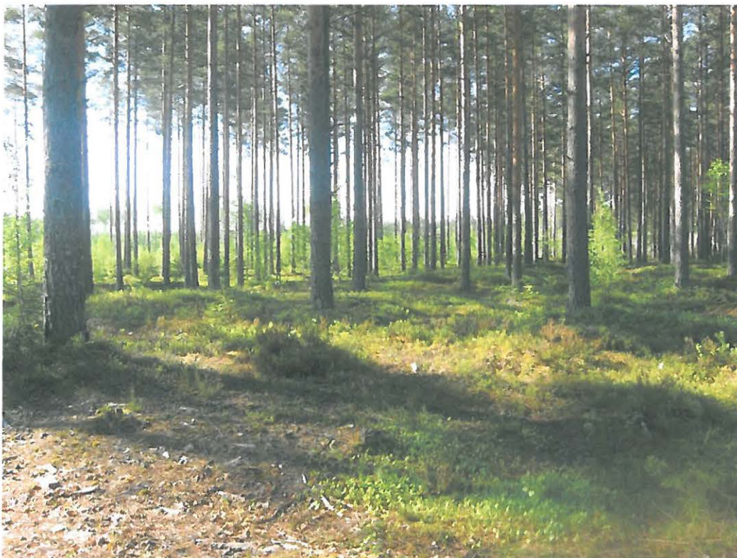
Kuva 1: Tervahauta 1 keskellä suoraan edessä ja tervahauta 2 sen takana oikealla. N. Kuva: KyM/M. Kykyri