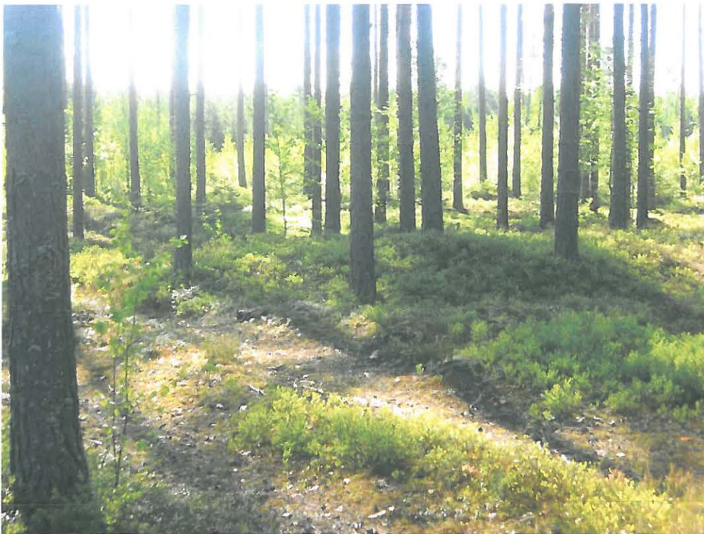
Kuva 3: Tervahauta 2 ja sen pohjoisreunan päältä kulkeva kärrytie. NW.