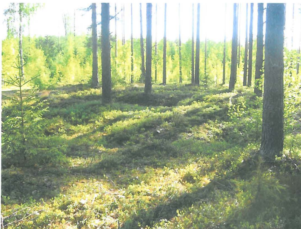
Kuva 2: Tervahauta 1. NW.