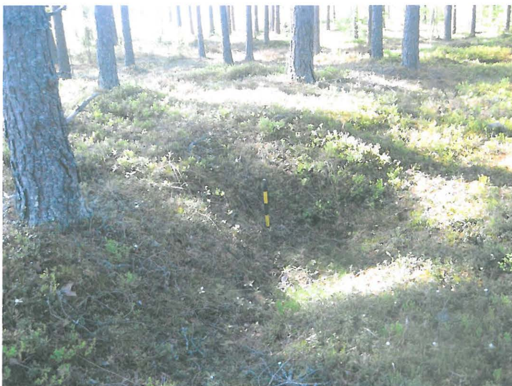
Kuva 4: Tervahauta 1:tä kiertävää ojaa. W. KyM/M. Kykyri