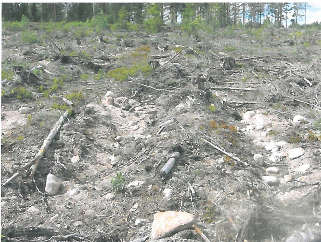
Kuva 4: Metsäkoneiden jälkeensä jättämää maastoa. SE.