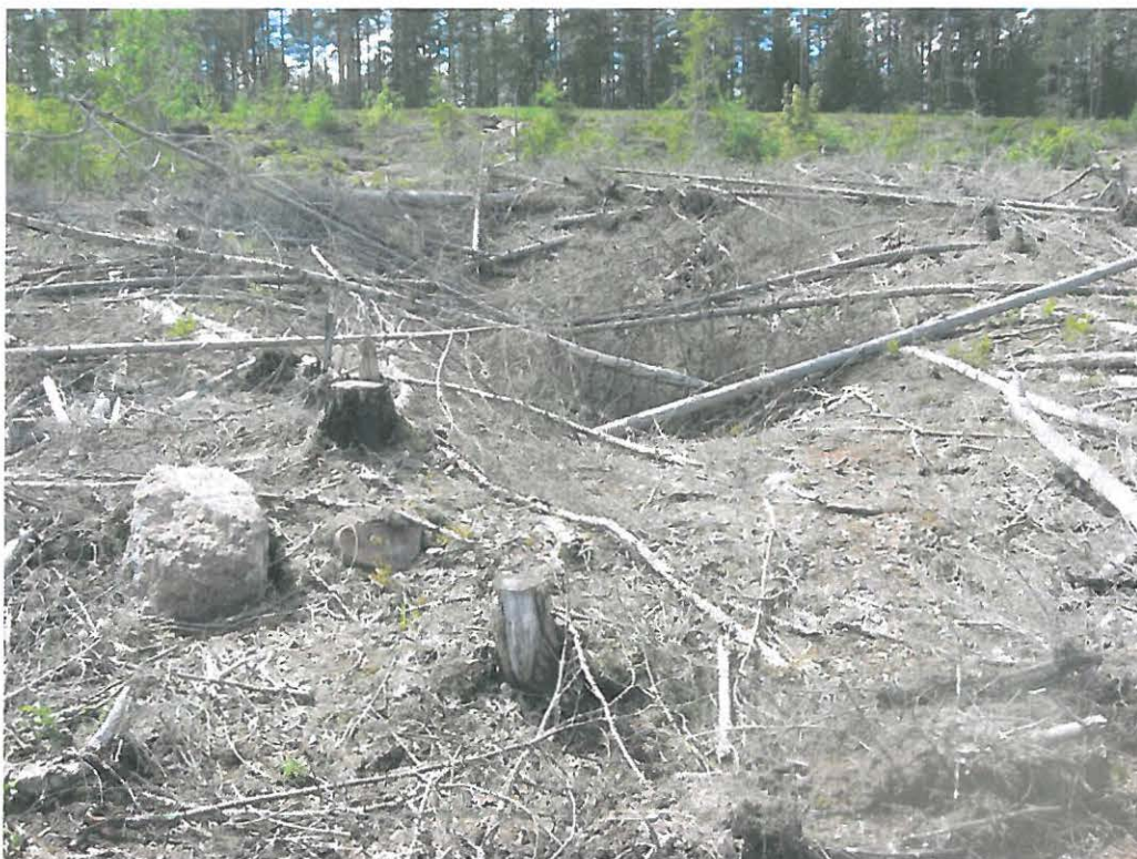
Kuva 3: Tervahauta 3:n puunrangoilla täytettyä keskustaa. E.