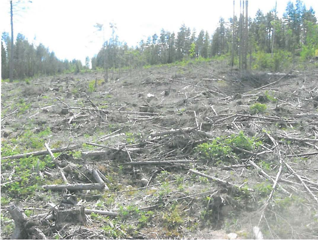
Kuva 1: Yleiskuva tervahautamaastosta. N.