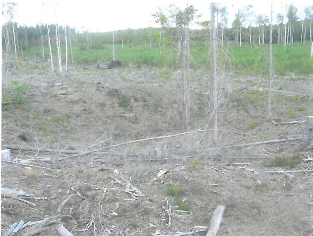
Kuva 2: Tervahauta 1:n keskustaa. S.