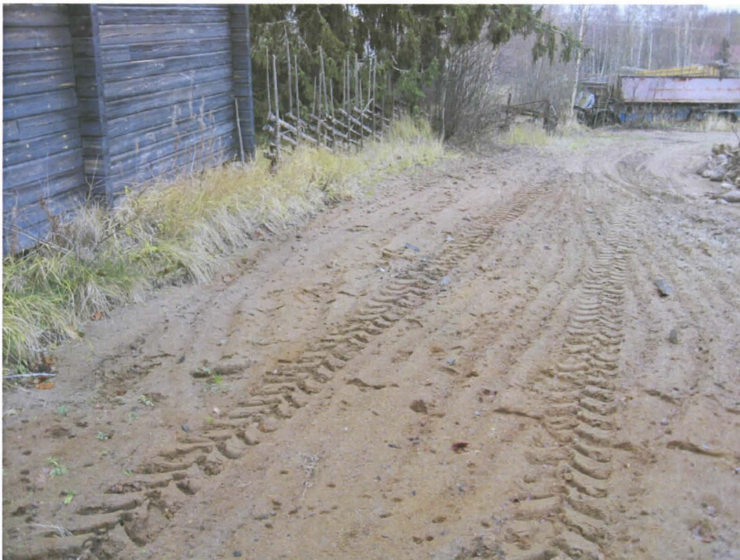
Kuva 1. Muokattua aluetta länsiluoteesta kuvattuna. Kuva DT2011:71:1.

KERTOMUKSEEN LIITTYVÄT KUVAT: