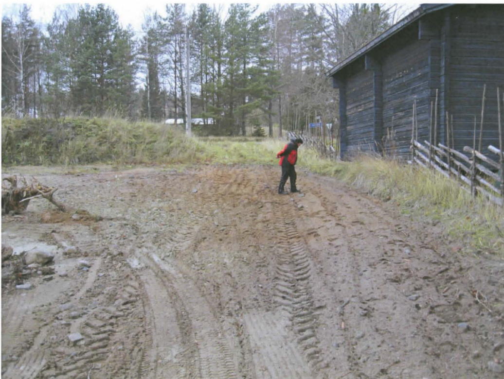
Kuva 2. Muokattua aluetta itäkaakosta kuvattuna. Kuvassa erikoissuunnittelija Satu Mikkonen-Hirvonen. Takana Söderlångvikeniin johtava tie. Kuva DT2011:71:2.