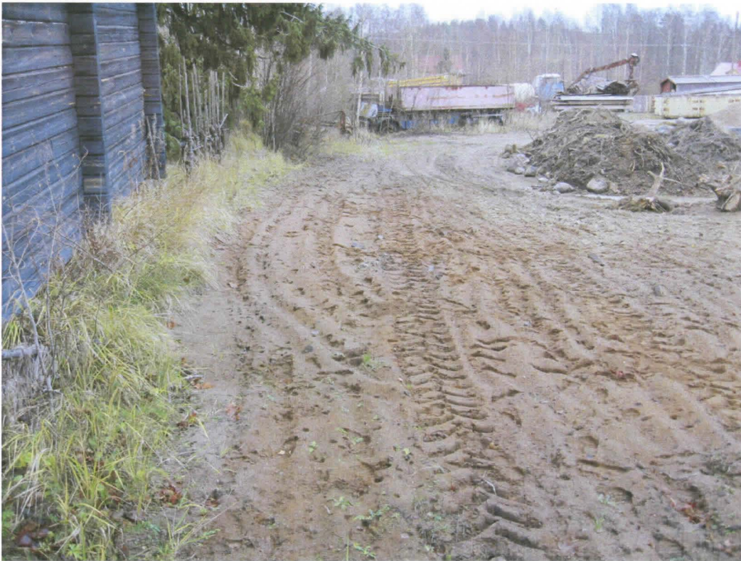
Kuva 3. Muokattua aluetta länsiluoteesta kuvattuna. Taustalla varikkoaluetta. Kuva DT2011:71:3.