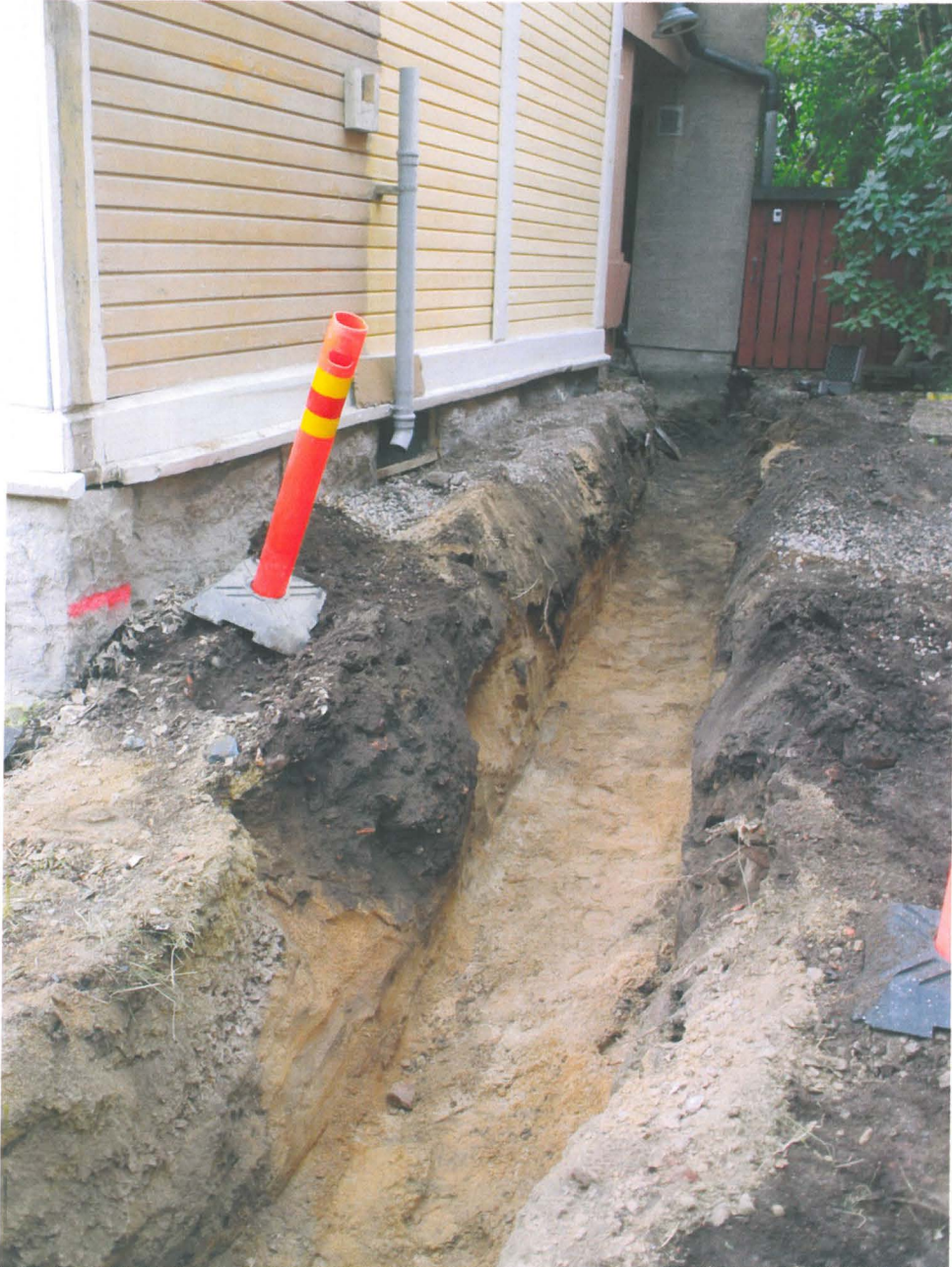
Kuva 2. Piha-alueen ja katualueen liittymiskohta. Kuvassa esillä profilissa katulinjassa ollut tumma multamaakuopanne. (Kuva K. Uotila / elokuu 2011).