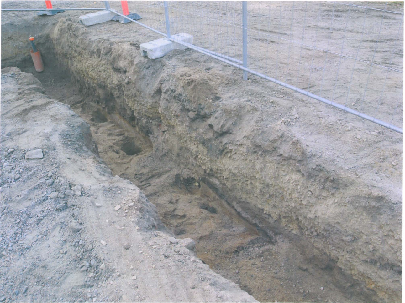
Kuva 1. Katualueen itäinen osa ja sen eteläprofiilin säilyneet maakerrokset. (Kuva K. Uotila / elokuu 2011).