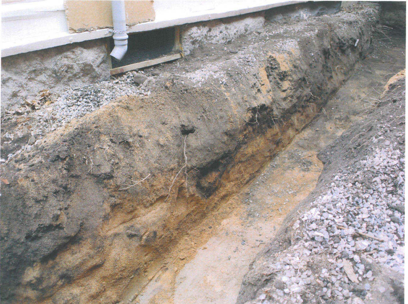
Kuva 3. Piha-alueen itäprofiilin kerrokset..