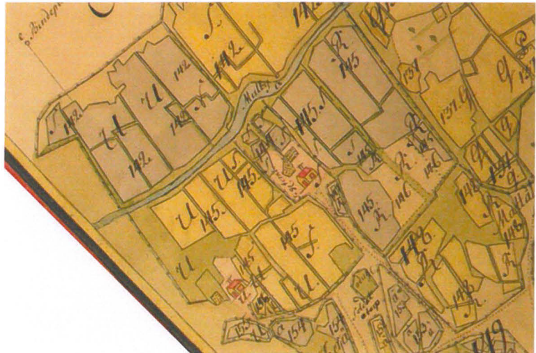
Mulbyn kylä 1700-luvun keskivaiheella. Nissin talo on merkitty kirjaimella S, Nissin tonttimaan pohjoispuolella (nro 144 kartassa) sijaisevat "Tomtkyor"-nimisiä pieniä pelkolohkoja. Numero 145 ovat itäinen ja läntinen "Hemåker" (Kartta KA)

Mulbyn kylä on yksi Kaukalahden tytärkylästä. Mulbyn kylä-asutus on muodostunut keskiajan kuluessa. Kylässä on 1540 veroluettelon mukaan ollut viisi tilaa. 1500-luvun lopulla kylä köyhtyi, ja useampi tila merkittiin veroluetteloihin maksukyvyttömiksi) sanoilla "öde" tai "utfattig". 1580-luvulla talonpojat jakoivat keskenään yhden autiotilan maat, ja 1600-luvun alusta lähtien kylässä oli vain neljä tilaa jäljellä. Nämä tilat olivat nimeltään Petas, Niss, Jupp ja Hinds. (Suomen asutuksen yleisluettelo, Lindholm 1999: 15-17)