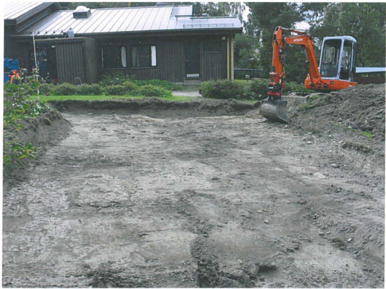
Tutkimuksia varten avattiin n. 6x11m alue tulevan omakotitalon paikalle. Peltomullan alta ei löytynyt rakenteita. Kuva UR.

Seurantatutkimuksen aikana avattiin yksi n 6 x 11 m kokoinen alue tulevan omakotitalon kohdalle, sekä yksi n 14 m pitkä ja 0,7 m leveä koeoja tulevan talon nurkasta tielle päin. Tähän kohtaan oli suunniteltu vesijohtokaivantoja. Yhteensä avattiin noin 80 m 2 kokoinen alue. Seurantatutkimuksen aikana ei suoritettu varsinaisia mittauksia, vaan avattiin alue, jonka rakennuttaja oli mitannut paikalle valmiiksi.