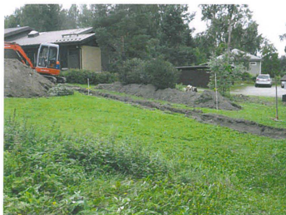
Kuva nro.2883:6. Äminnenranta 4, nurmikon pohjoisosa, kuvattuna idästä, kaivausten jälkeen. 22.8.2011 UR.