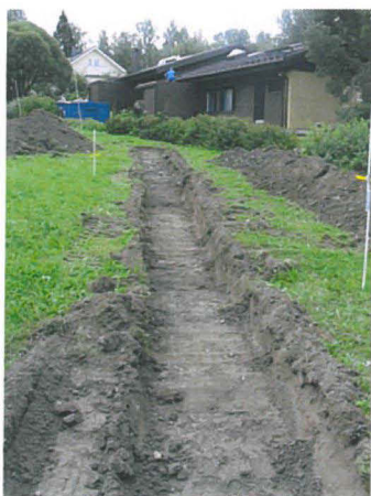
Kuva nro 2883:2. Koeoja pohjoisesta, peltomulta poistettu. 22.8.2011 UR.