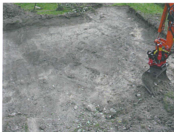
Kuva nro 2883: 5. Kaivausalue ylhäältä/pohjoisesta. 22.8.2011 UR.