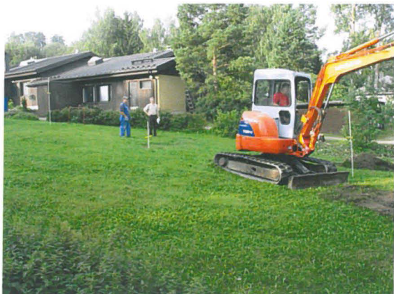
Kuva nro 2883:1. Äminnenranta 4. Nurmikkoalue ennen kaivamista. 22.8.2011 UR.