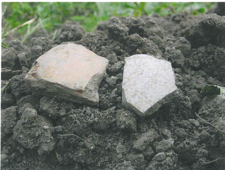
Sekoittuneesta peltokerroksesta löytyi myös n 1800-luvun talousjätettä. Kuvassa punasavivadin ja seltteripullon pala. Löytöjä ei otettu talteen. Kuva UR.

Kohde sijaitsi pohjoiseen/luoteeseen viettävällä nurmikolla, pientaloasutuksen ympäröimänä. Nurmikon alla oli n 50 cm paksu sekoittunut vanha peltokerros. Maaperä oli multaista hiesusavea, pohjamaa oli savea. Sekoittuneen peltomullan alta ei tullut vastaan mitään vanhempaan asutukseen liittyviä rakenteita. Sen sijaan peltokerroksessa oli moderneja häiriöitä, kuten täytemaata, kaivantoja, lankanauvoja ja muovipaloja. Nämä liittyvät todennäköisesti samalla tontilla 1980-luvun alussa rakennettuun paritalon rakentamisvaiheeseen. Alueen itäosassa löytyi jopa kaivinkoneen kauhasta irronnut piikki. Peltomullan alla oli koko alueella steriili pohjasavi. Peltomullan ja pohjasaven rajapinnassa esiintyi hiiltä paikoissa, joissa ei ollut moderneja häiriöitä.