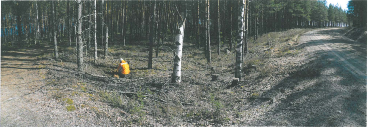
Monitonlahti 2, todennäköinen asumuspainanne 2 on jäänyt osin teiden pohjustusmaiden alle. Kuvassa Teija Alenius tutkimassa painanteeseen tehtyä koepistoa. Vasemmalla Rokansalontie. Kohti kaakkoa.