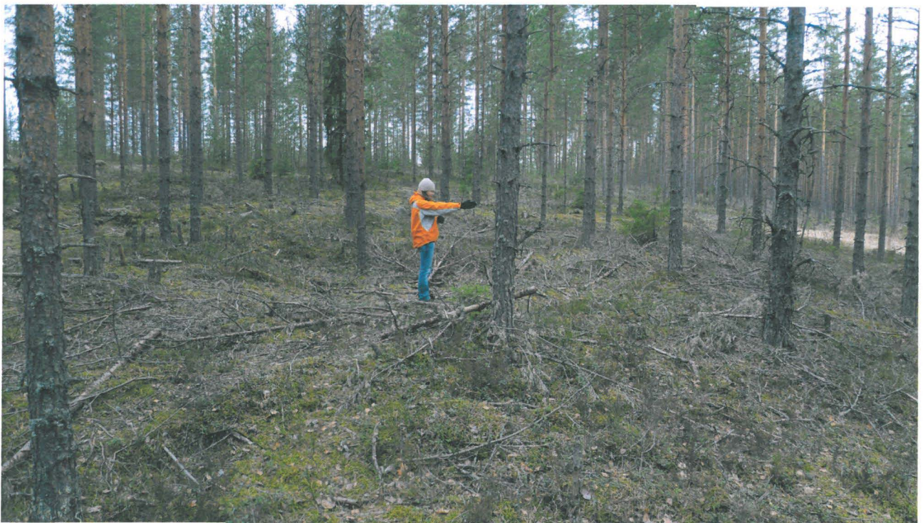
Monitonlahti 1, Teija Alenius seisomassa asumuspainanteen keskellä. Kohti länttä.