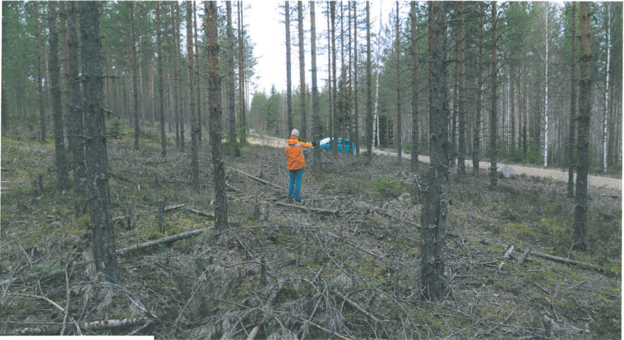
Monitonlahti 1, Teija Alenius seisomassa asumuspainanteen keskellä. Kuvassa oikealla Rokansalontie. Kohti loudetta.