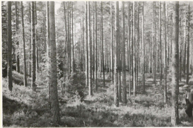
10751 Kuva maastosta, jossa on epämääräisiä mitä sisältäviä kuopanteita.