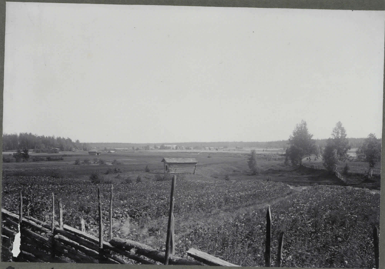
Kivikauden asuinpaikka Viitankaan päässä Vähänkösken l. Koskelan torpan maalla Paattikosken kylän seudusta Karvian joen oik. puolella (löytöpaikka on otualla oleva pelto joen entiseen sivuhaaran varrella) Talok. Tutkimus Kesä 1910.