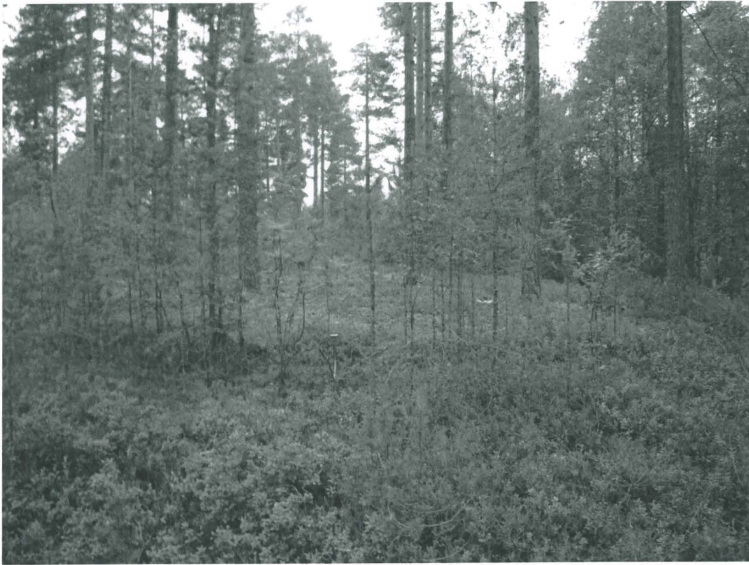
Kuoppa 3 kaakosta