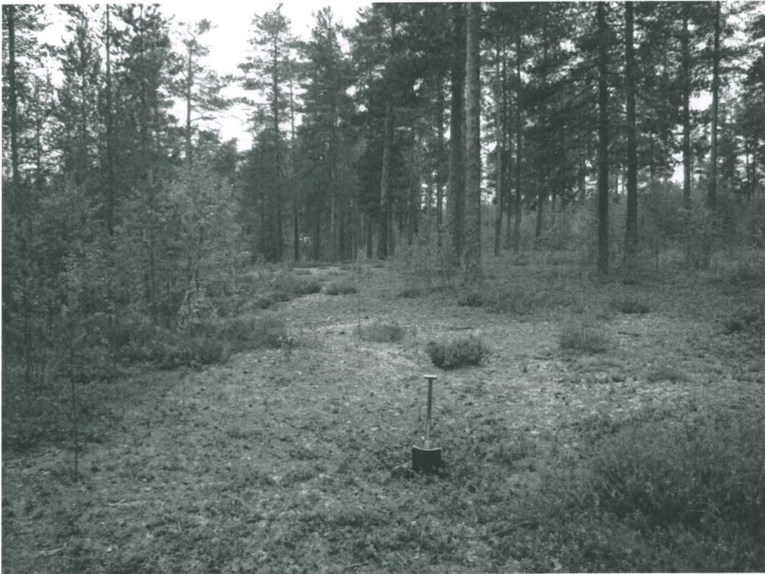
Kuoppa 4 etelästä