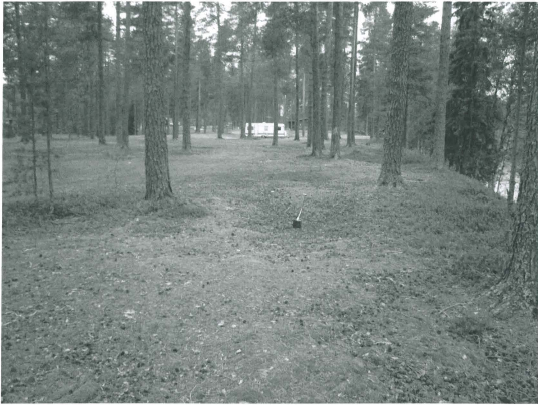
Kuoppa 1 itäkaakosta