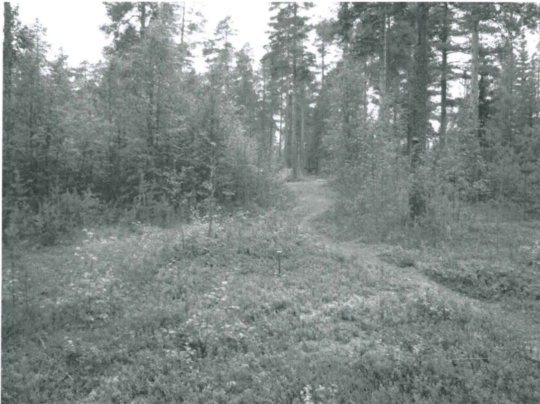
Kuoppa 2 itäkaakosta