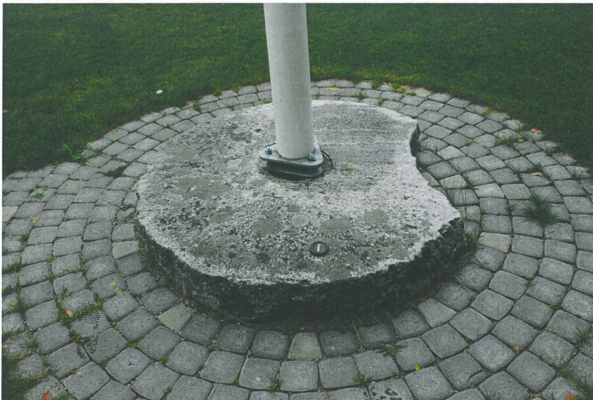
Kuva 1. Myllynkivi lipputangon jalkana. Kuva lännestä.