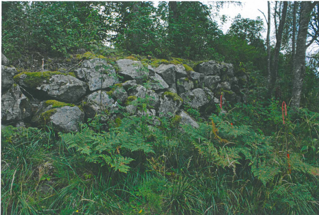
1. Kylmämuurattua muuria pengerryksen luoteiskulmassa. Kuvassa myös kaksi tiealueen linjaukseen kuuluvaa paalulinjausta on siirretty lähemmäksi kuvan ulkopuolelle jäävää tietä (oikealla). Kuva luoteesta. Alho_1.jpg