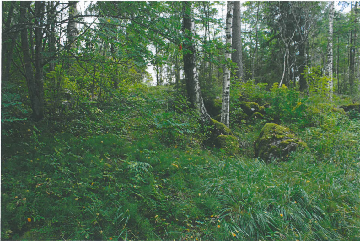
3. Alhon kartanolta laskeutuva pohjois-eteläsuuntainen tie (ks. kartta). Oikealla näkyvissä pengerrysmuuria. Kuva pohjoisesta. Alho_3.jpg