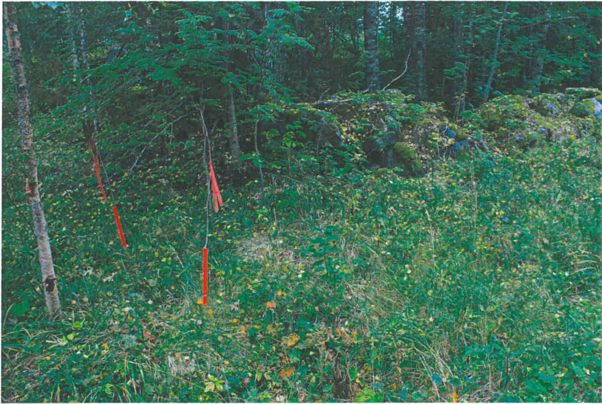
5. 1800-luvulla rakennetun navetan jäännökset terassipengerryksen pohjoispuolella. Taustalla näkyy puiden välistä terassipengerryks. Alueen koilliskulma. Kuvassa vasemmalla kaksi teialueen linjaukseen kuuluvaa paalua – linjausta on muutettu lähemmäksi tietä. Kuva tieltä pohjoispuolelta. Alho_5.jpg