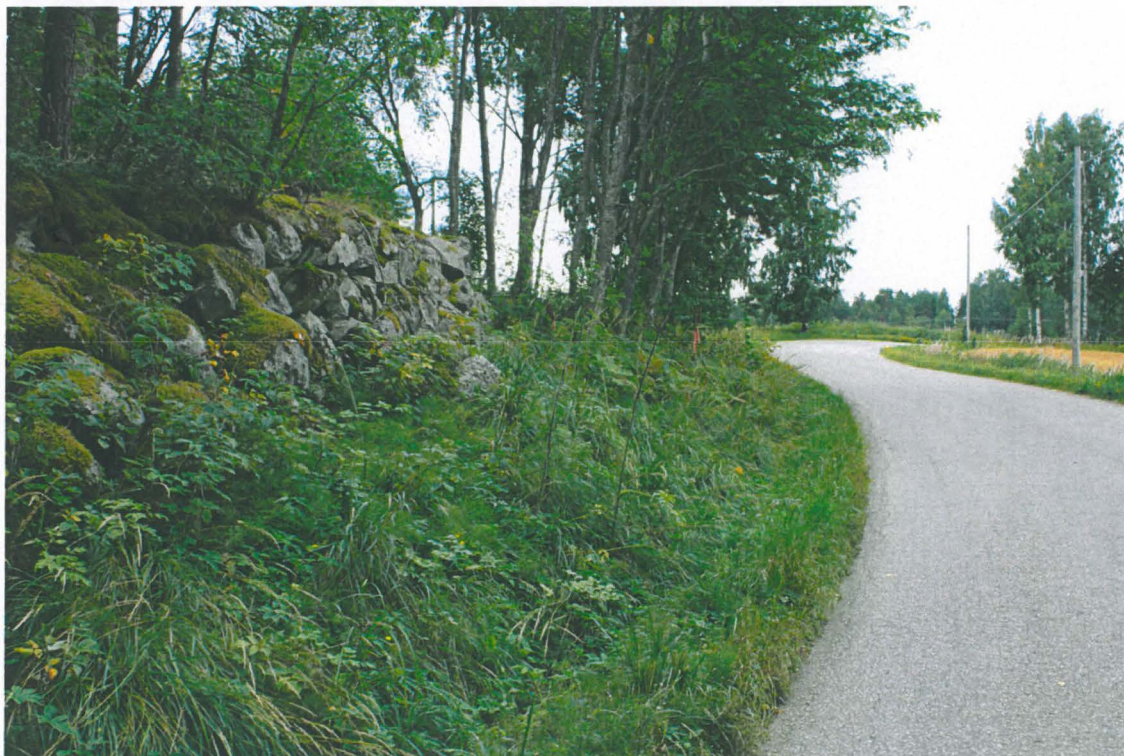
2. Pengerrysmuuria pohjoissivulla (kuvassa muurin luoteiskulma). Kuva koillisesta. Alho_2.jpg