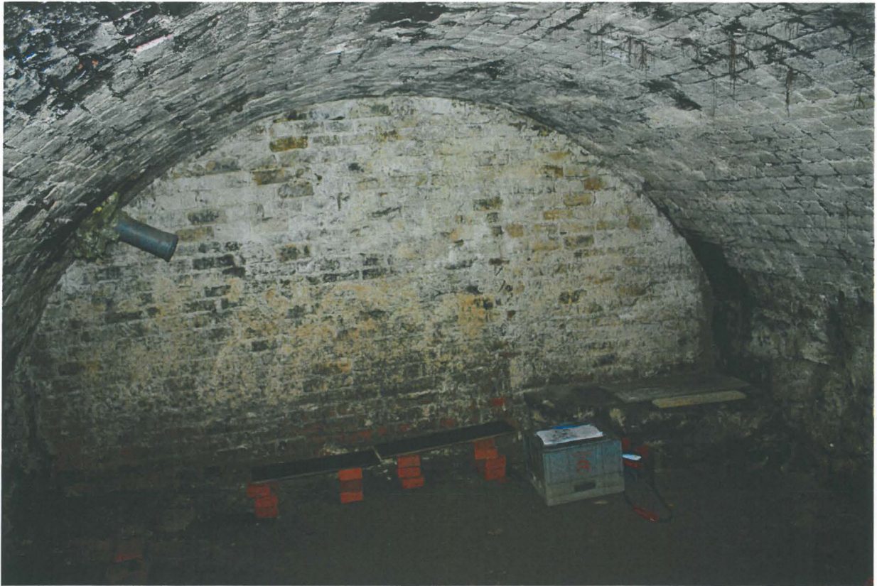
7. Holvikellari. Kuva oviaukolta, idästä. Alho_7.jpg