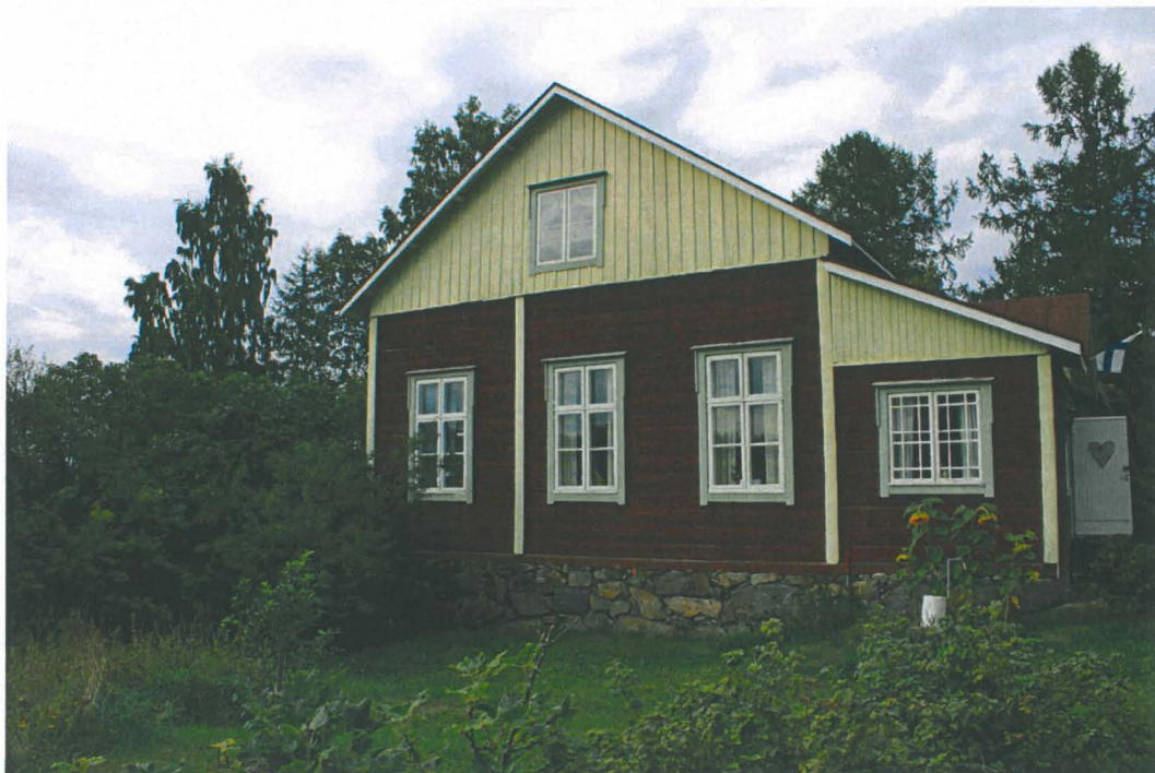
6. Nykyinen päärakennus. Kuva etelästä. Alho_6.jpg