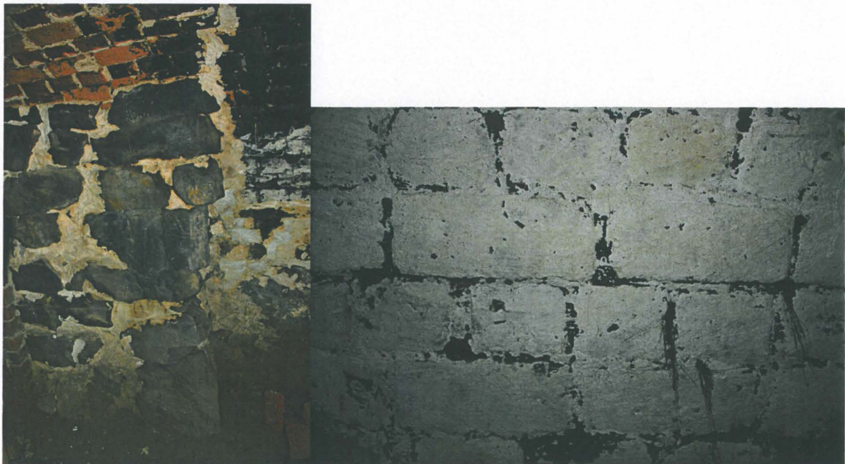
8. Vasen. Kivinen tukirakenne holvikellarin kaakkoiskulmassa, oven vieressä. Oikea. Yksityiskohta muurauksesta holvin pohjoissivulla. Alho_8.jpg