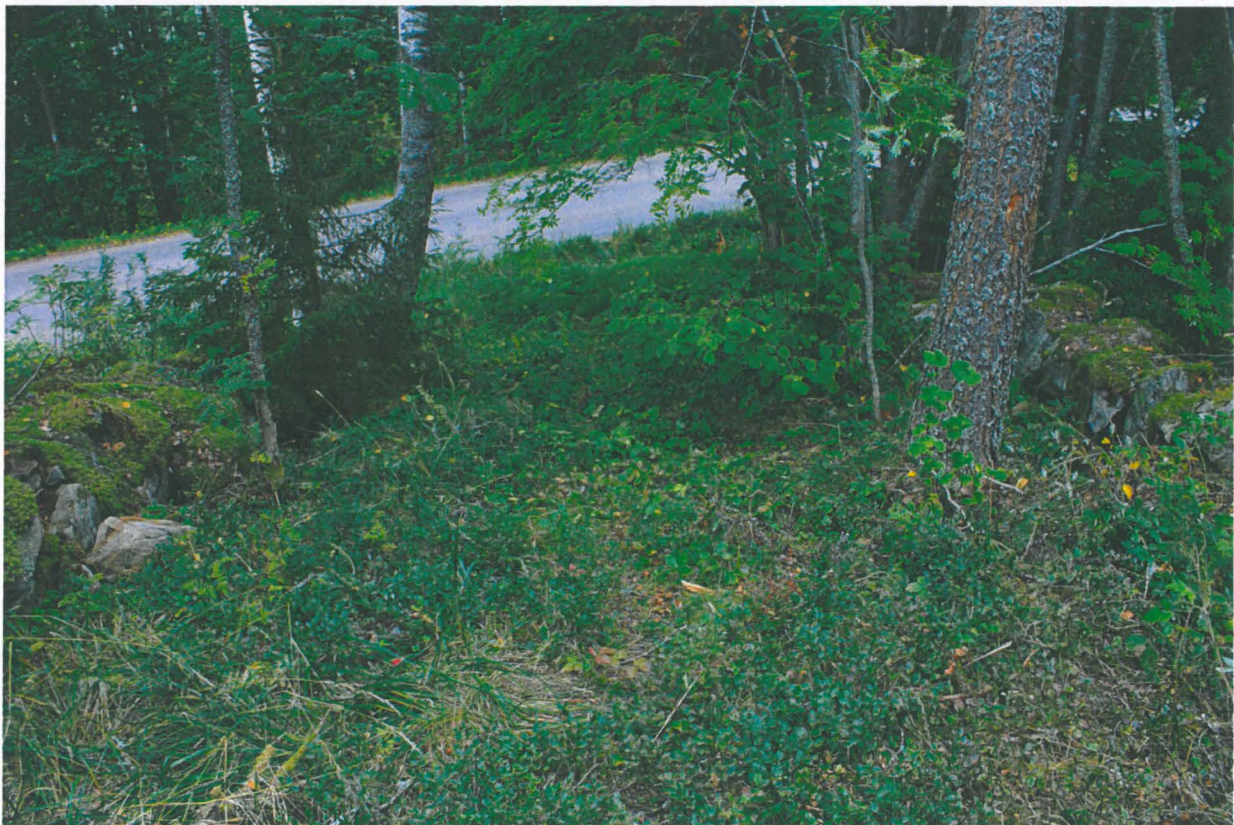
4. Sama tie. Kuvattuna etelästä. Molemmilla sivuilla kivimuurit. Alho_4.jpg